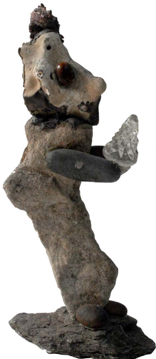
133 (Br:16 cm. H:33 cm. Dj:13 cm.)