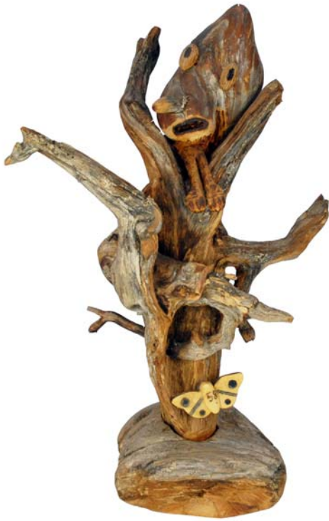
099 1958 (Br:23 cm. H:45 cm. Dj:30 cm.)