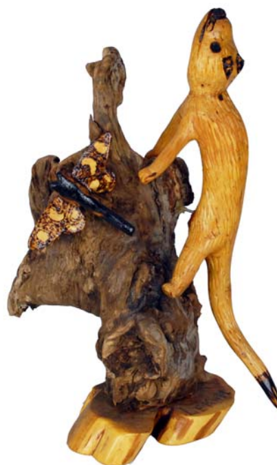
184 (Br:25 cm. H:40 cm. Dj:24 cm.)