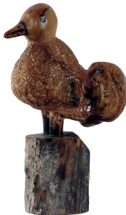
123 (Br:19 cm. H:24 cm. Dj:14 cm.)