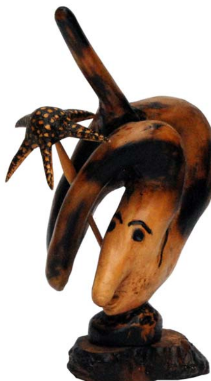
077 (Br:16 cm. H:30 cm. Dj:15 cm.)