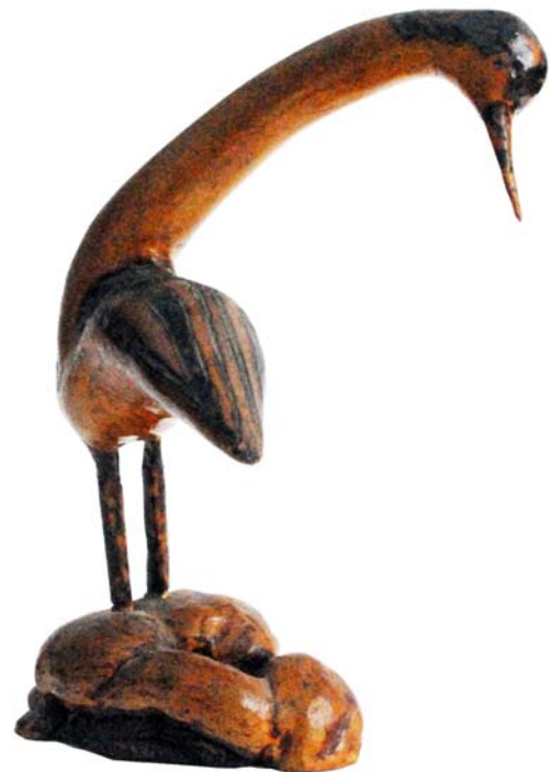
114 (Br:20 cm. H:33 cm. Dj:24 cm.)