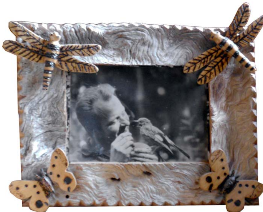
160 (Br:33 cm. H:27 cm. Dj:5 cm.)