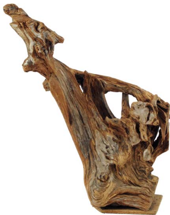
064 (Br:60 cm. H:60 cm. Dj:38 cm.)