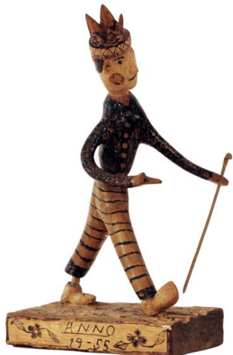
035 1955 (Br:20 cm. H:42 cm. Dj:25 cm.)