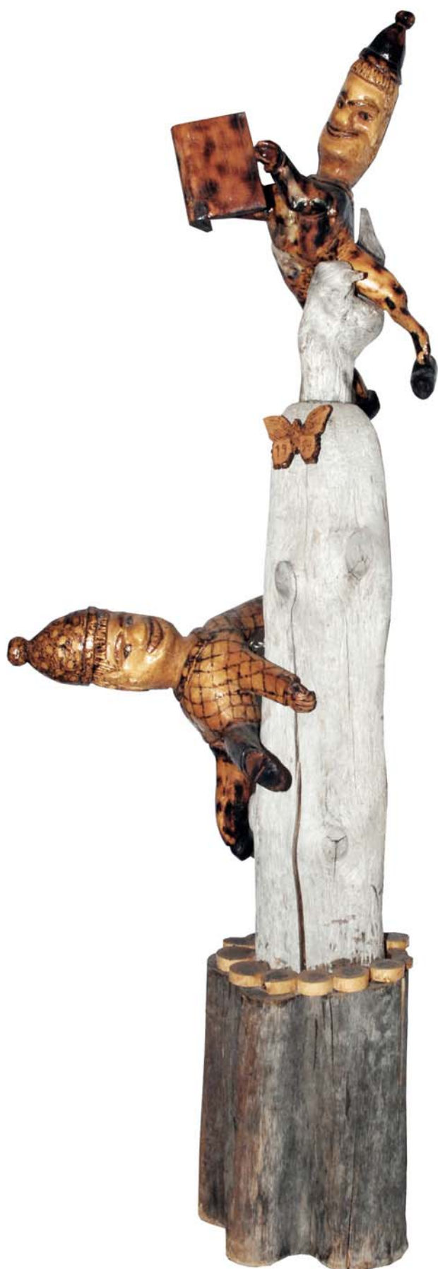
072 1994 (Br:45 cm. H:130 cm. Dj:60 cm.)