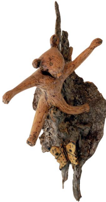
188 1971 (Br:17 cm. H:38 cm. Dj:30 cm.)