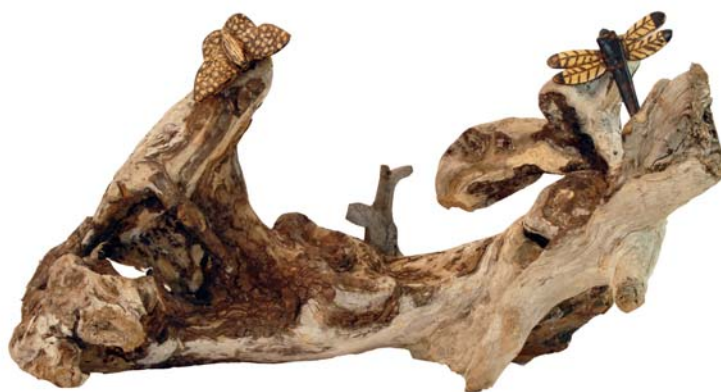
065 (Br:70 cm. H:40 cm. Dj:40 cm.)