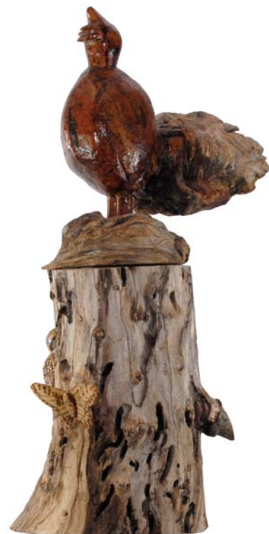
121 (Br:32 cm. H:75 cm. Dj:36 cm.)