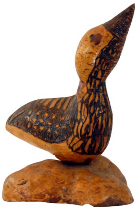
126 (Br:18 cm. H:23 cm. Dj:17 cm.)