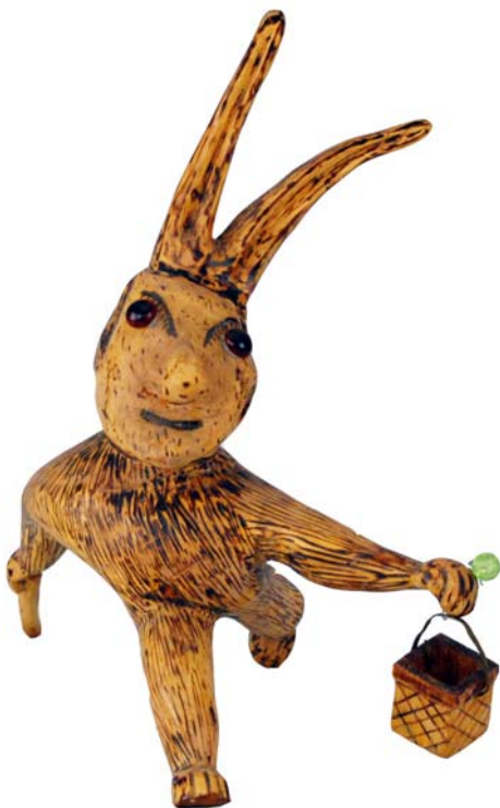
014 (Br:29 cm. H:30 cm. Dj:15 cm.)