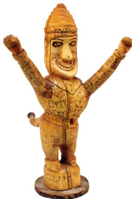
031 Talaren från sagornas Trollskog 1978 (Br:33 cm. H:48 cm. Dj:35 cm.)