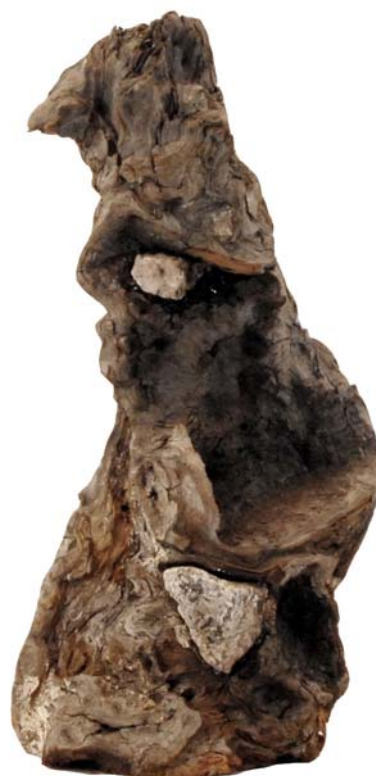
134 (Br:19 cm. H:33 cm. Dj:16 cm.)