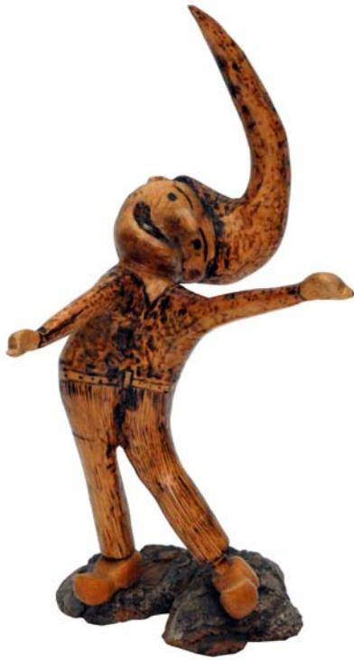
020 (Br:20 cm. H:33 cm. Dj:24 cm.)