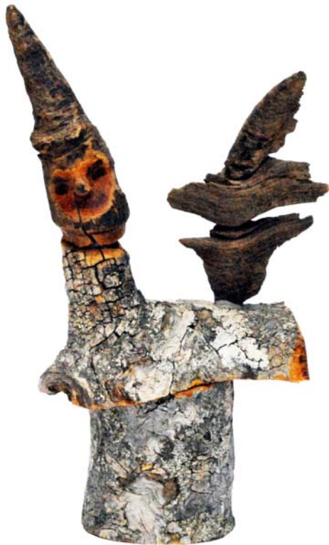
101 (Br:16 cm. H:29 cm. Dj:12 cm.)