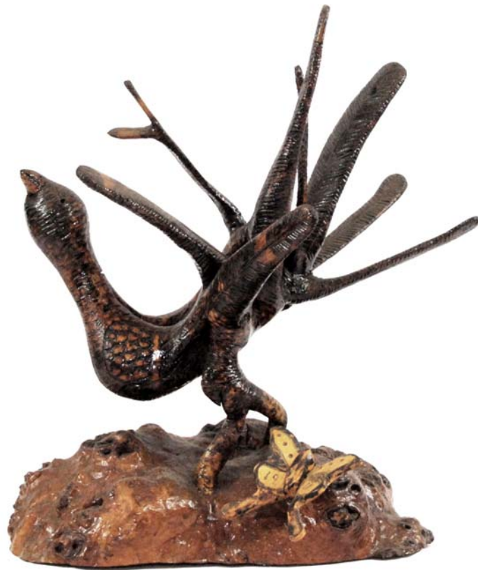
132 1958 (Br:35 cm. H:43 cm. Dj:25 cm.)