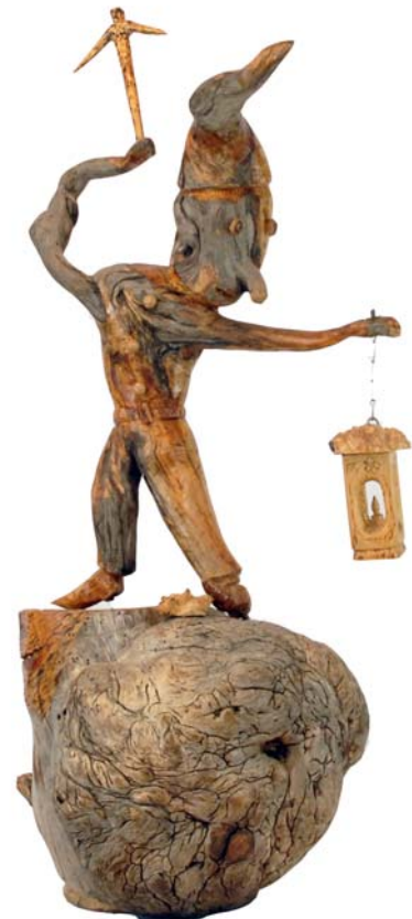
091 1969 (Br:40 cm. H:82 cm. Dj:43 cm.)