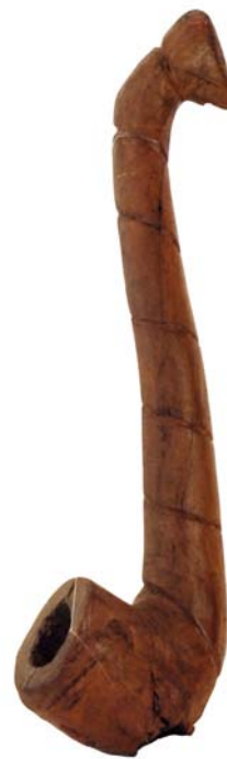
178 (Br:12 cm. H:62 cm. Dj:18 cm.)