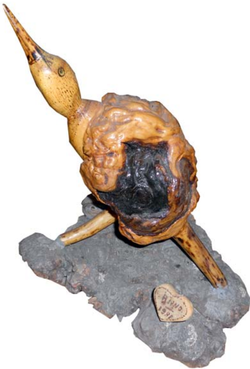
111 1988 (Br:30 cm. H:40 cm. Dj:25 cm.)