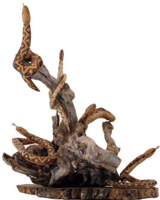
059 (Br:50 cm. H:63 cm. Dj:40 cm.)