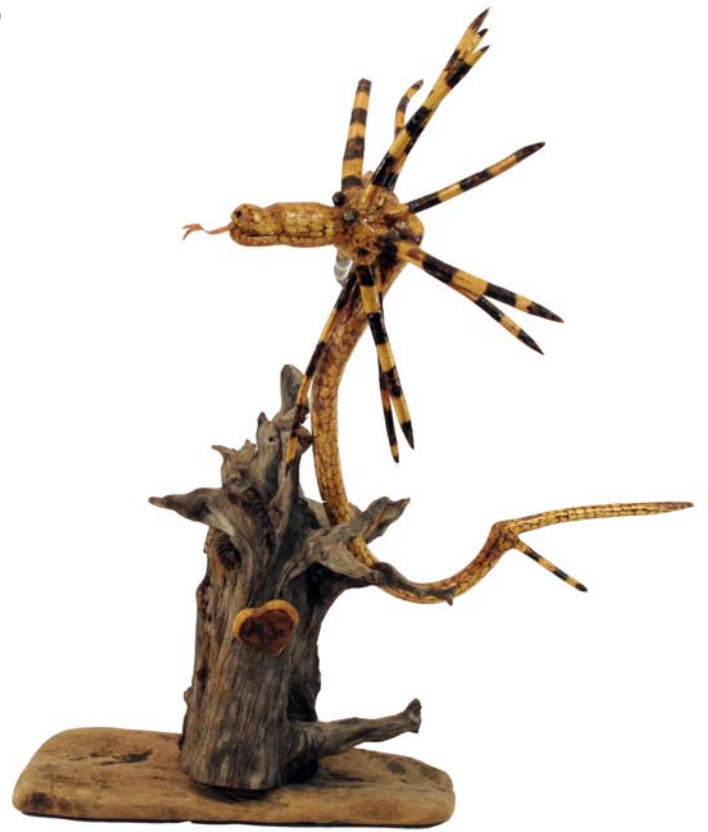
196 1981 (Br:60 cm. H:65 cm. Dj:45 cm.)