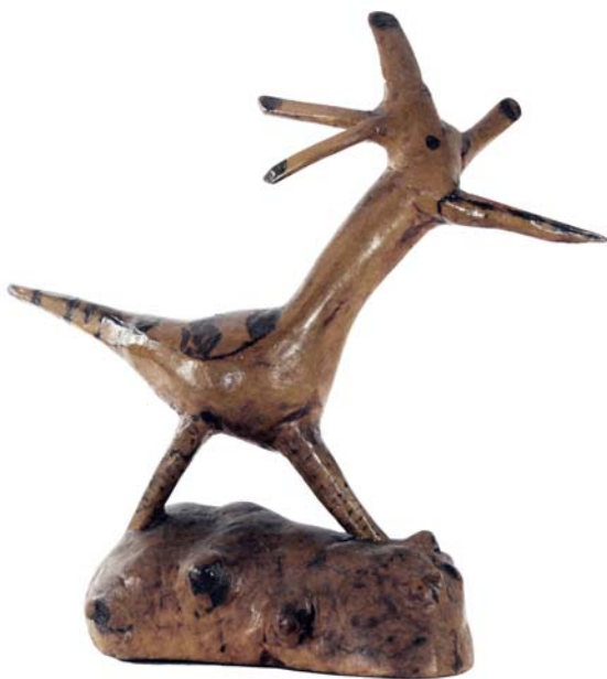
120 1997 (Br:25 cm. H:30 cm. Dj:15 cm.)