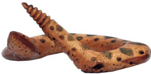
204 (Br:20 cm. H:10 cm. Dj:20 cm.)