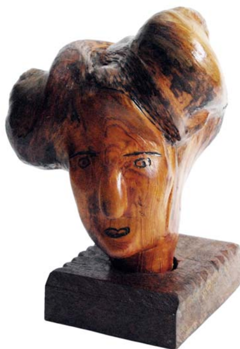
075 (Br:20 cm. H:25 cm. Dj:18 cm.)