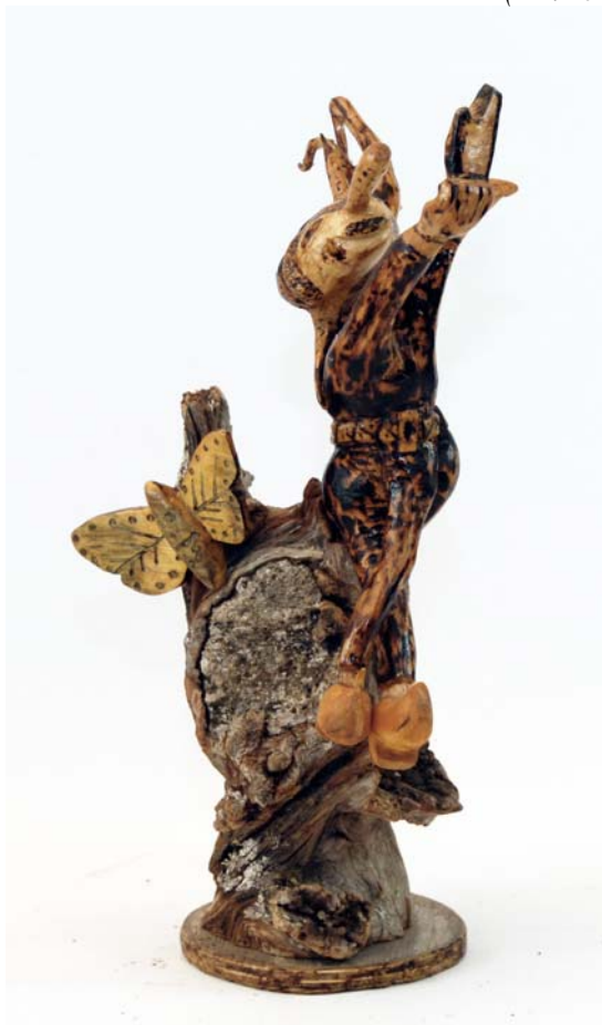
Jag hörde Fan spela - Sagofigur Pan 1978 (Br:40 cm. H:25 cm. Dj:25 cm.)