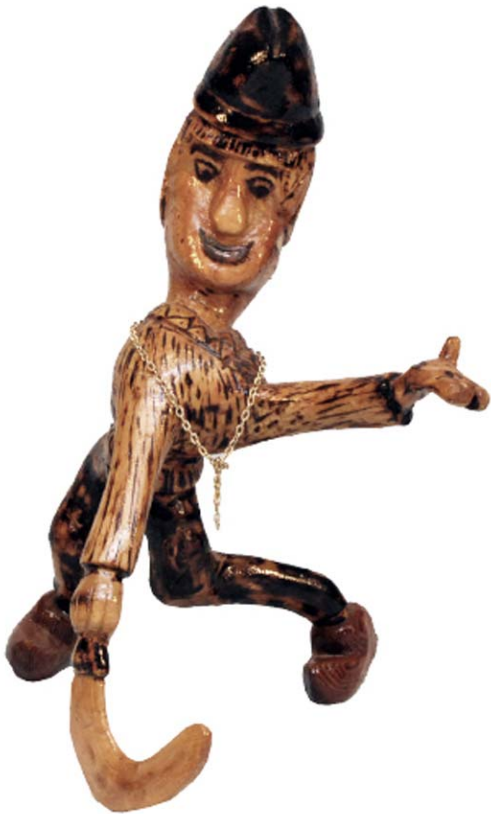
012 (Br:30 cm. H:38 cm. Dj:30 cm.)