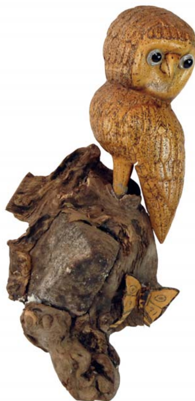
129 1971 (Br:30 cm. H:55 cm. Dj:20 cm.)