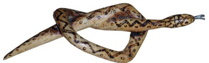
207 (Br:22 cm. H:9 cm. Dj:8 cm.)