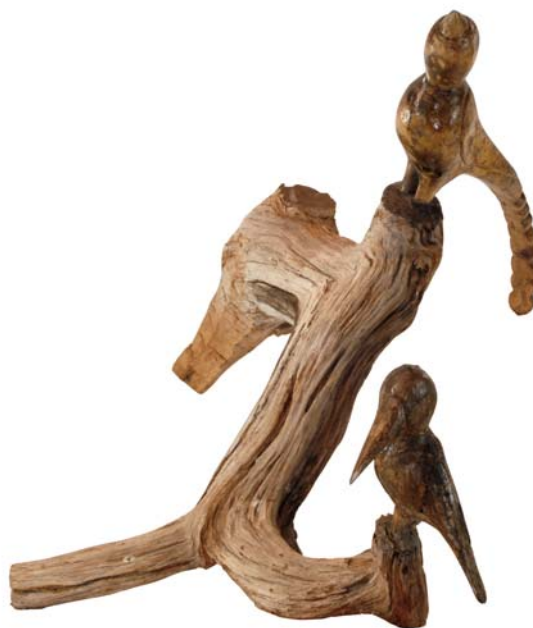
127 (Br:63 cm. H:60 cm. Dj:52 cm.)