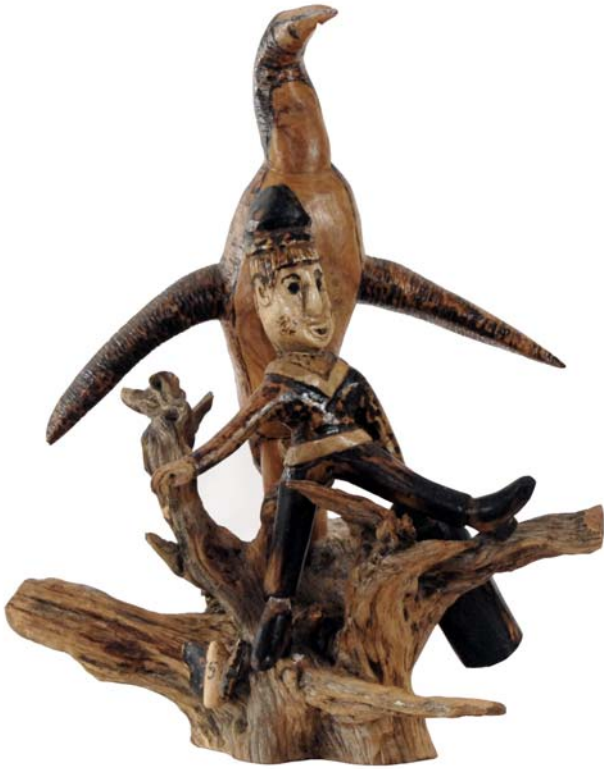
115 (Br:32 cm. H:37 cm. Dj:29 cm.)