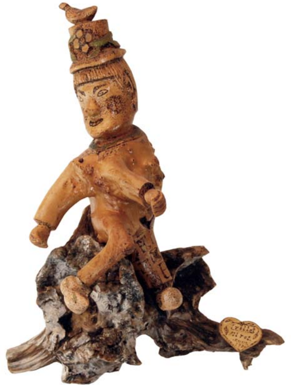
037 Trollet Alrot 1980 (Br:35 cm. H:43 cm. Dj:29 cm.)