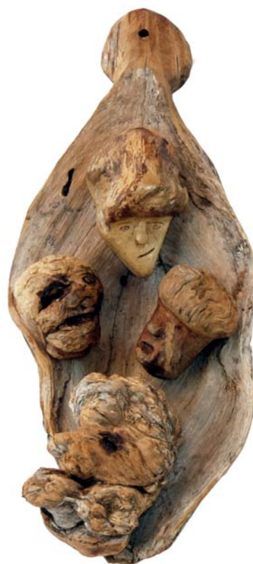
083 (Br:25 cm. H:50 cm. Dj:80 cm.)