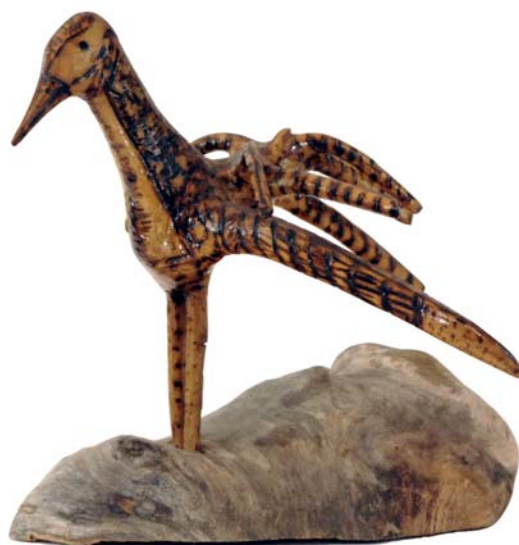
125 (Br:20 cm. H:19 cm. Dj:10 cm.)