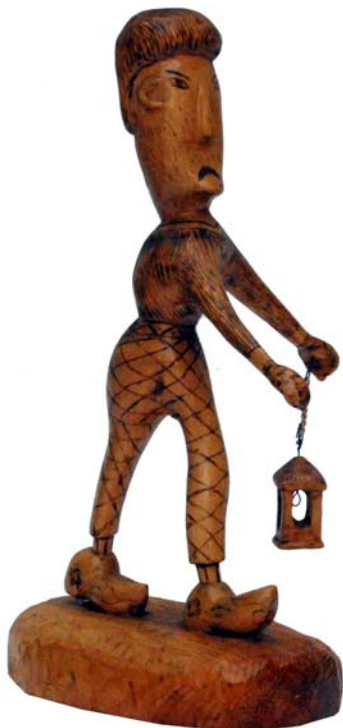
090 (Br:17 cm. H:31 cm. Dj:20 cm.)