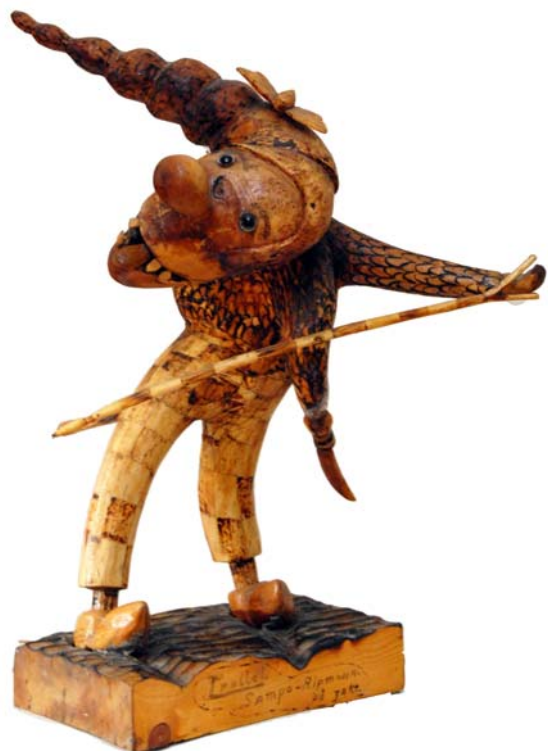
106 Trollet Sampo Ripmassa på jakt (Br:44 cm. H:73 cm. Dj:46 cm.)