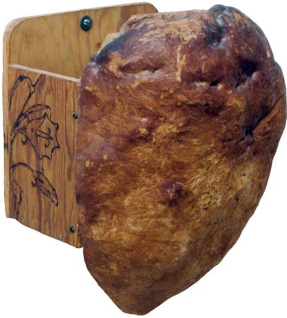
143 (Br:44 cm. H:33 cm. Dj:24 cm.)