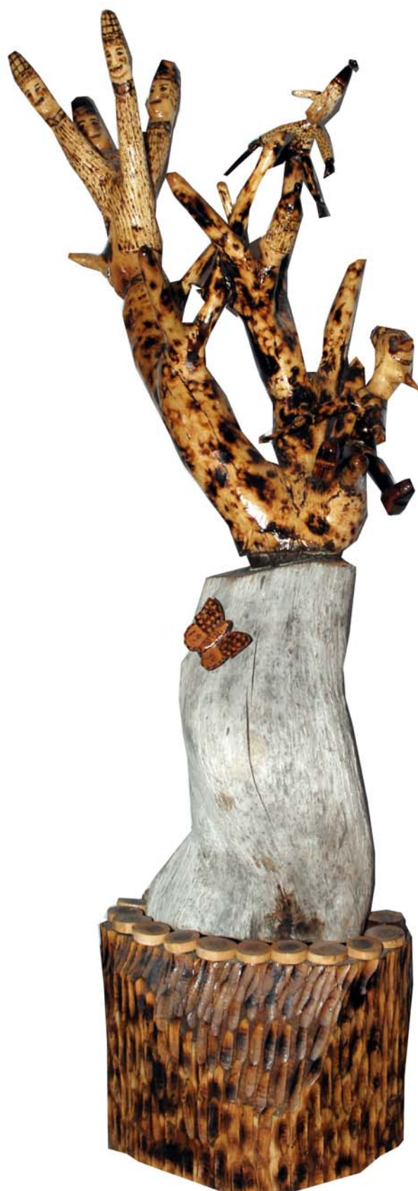
073 1994 (Br:50 cm. H:145 cm. Dj:55 cm.)