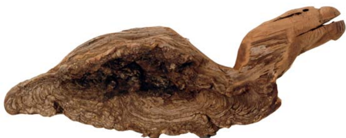
128 (Br:60 cm. H:28 cm. Dj:15 cm.)