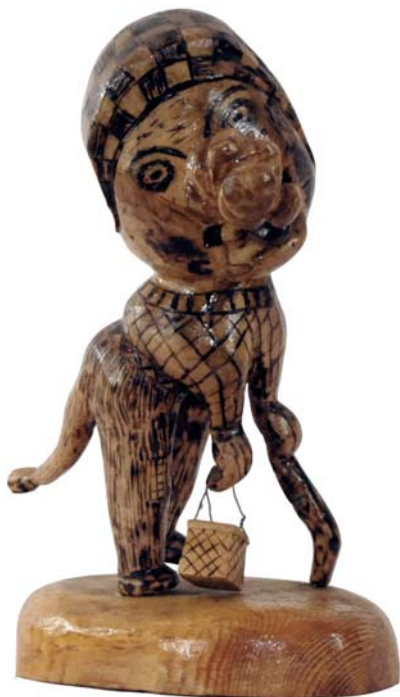
103 1970 (Br:18 cm. H:29 cm. Dj:20 cm.)