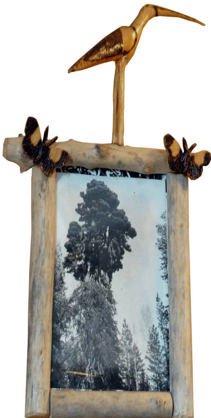
147 (Br:23 cm. H:37 cm. Dj:6 cm.)