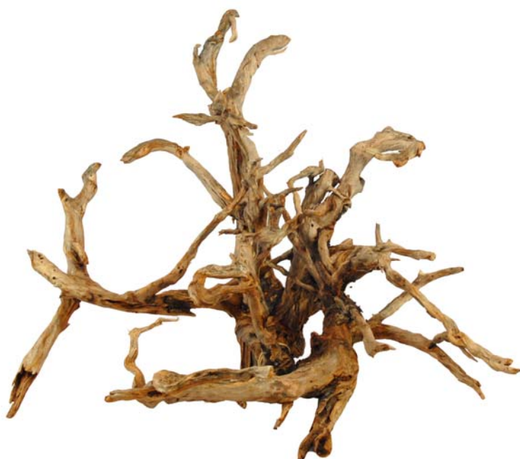
063 (Br:80 cm. H:60 cm. Dj:60 cm.)