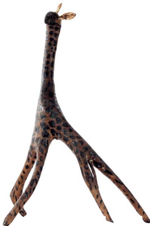
192 (Br:22 cm. H:33 cm. Dj:24 cm.)