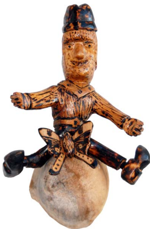
030 (Br:23 cm. H:34 cm. Dj:20 cm.)