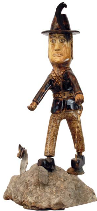
017 1997 (Br:10 cm. H:90 cm. Dj:40 cm.)