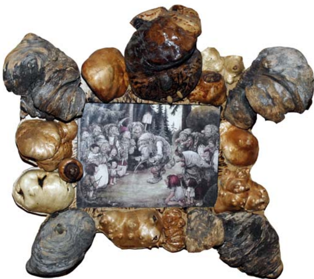
152 (Br:55 cm. H:55 cm. Dj:20 cm.)