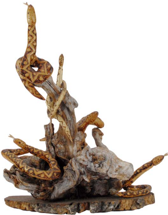
208 (Br:50 cm. H:58 cm. Dj:35 cm.)