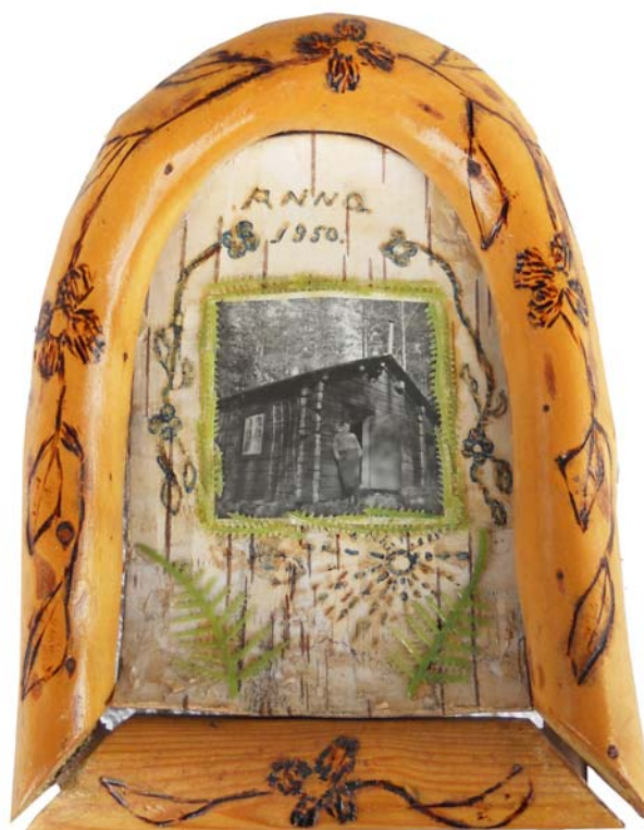
149 1950 (Br:17 cm. H:22 cm. Dj:12 cm.)