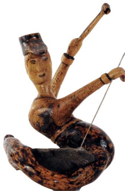
039 Stenborraren 1975 (Br:24 cm. H:29 cm. Dj:25 cm.)