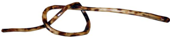
206 (Br:40 cm. H:15 cm. Dj:15 cm.)