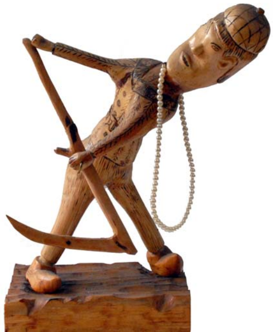
002 Skördaren 1971 (Br:27 cm. H:37 cm. Dj: 22 cm.)