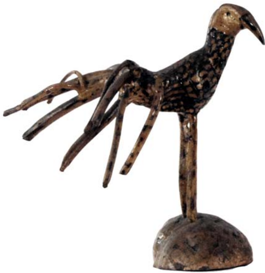
118 1955 (Br:22 cm. H:23 cm. Dj:14 cm.)