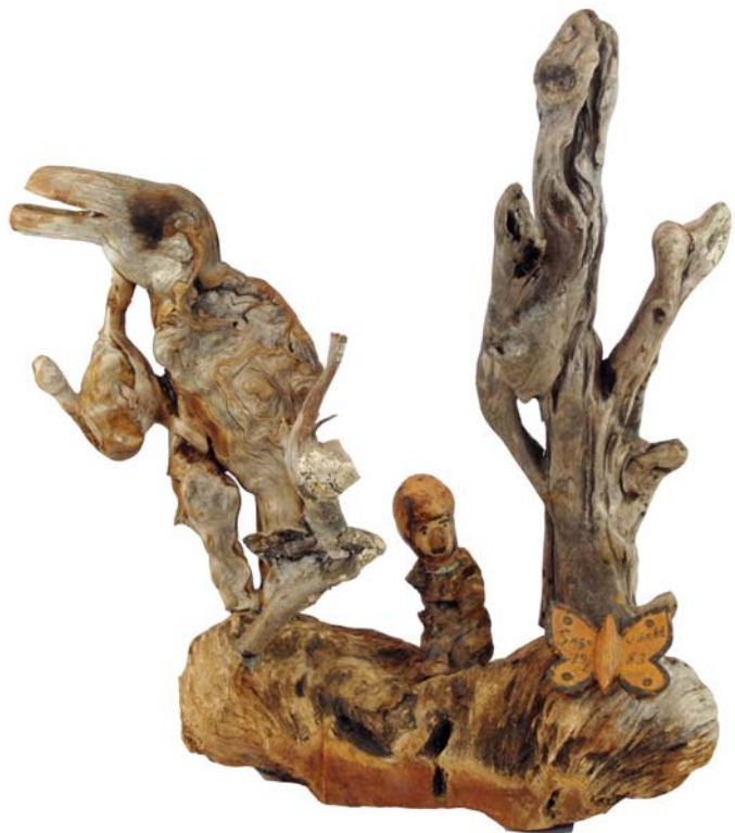
104 Sagovärld 1983 (Br:65cm. H:70 cm. Dj:35 cm.)