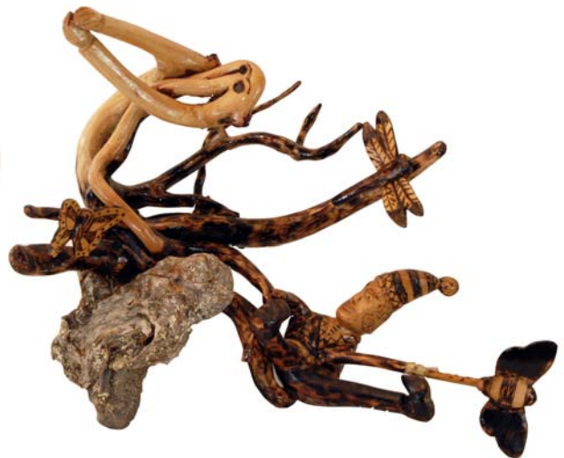
058 (Br:58 cm. H:50 cm. Dj:40 cm.)