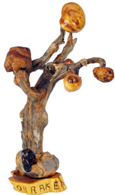
170 Torraken (Br:30 cm. H:45 cm. Dj:23 cm.)