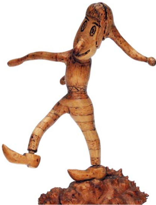
022 1962 (Br:24 cm. H:30 cm. Dj:14 cm.)