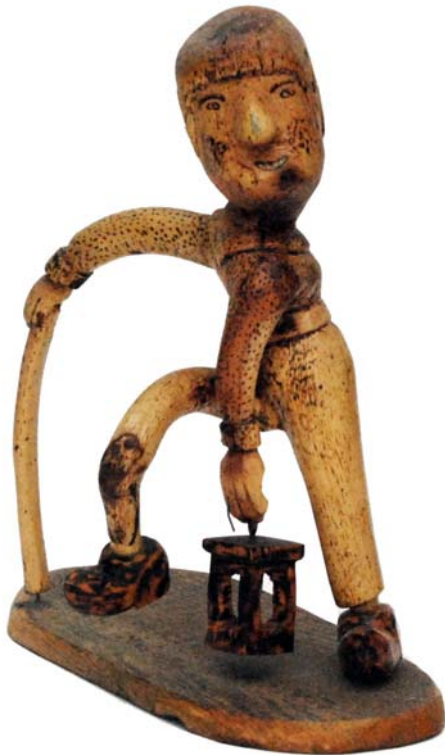
088 Kolvaktaren vid milan 1978 (Br:29 cm. H:30 cm. Dj:15 cm.)