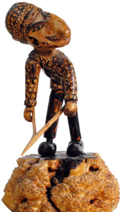
003 (Br:34 cm. H:54 cm. Dj:30 cm.)