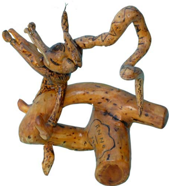
028 1971 (Br:35 cm. H:33 cm. Dj:28 cm.)