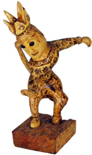
021 Bergakungen 1972 (Br:35 cm. H:45 cm. Dj:27 cm.)