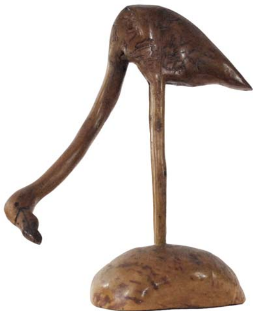
122 (Br:37 cm. H:48 cm. Dj:35 cm.)