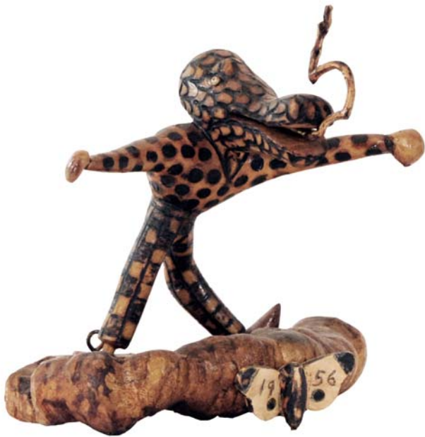
036 1956 (Br:21 cm. H:19 cm. Dj:18 cm.)