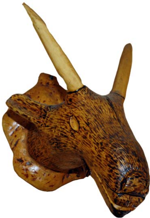
197 (Br:23 cm. H:42 cm. Dj:38 cm.)