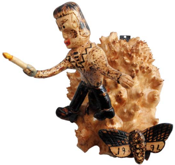
013 1991 (Br:23 cm. H:25 cm. Dj:25 cm.)