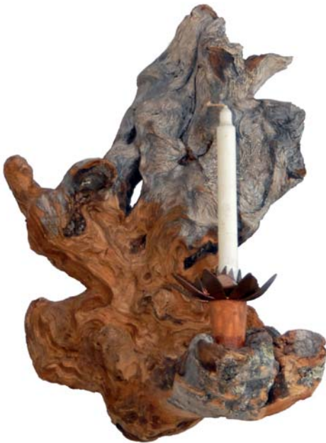
166 (Br:20 cm. H:32 cm. Dj:17 cm.)