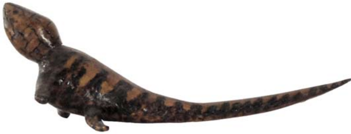
187 (Br:27 cm. H:9 cm. Dj:8 cm.)