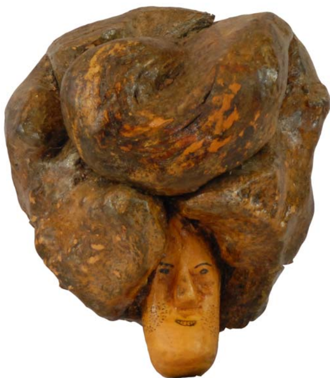
084 (Br:20 cm. H:25 cm. Dj:20 cm.)