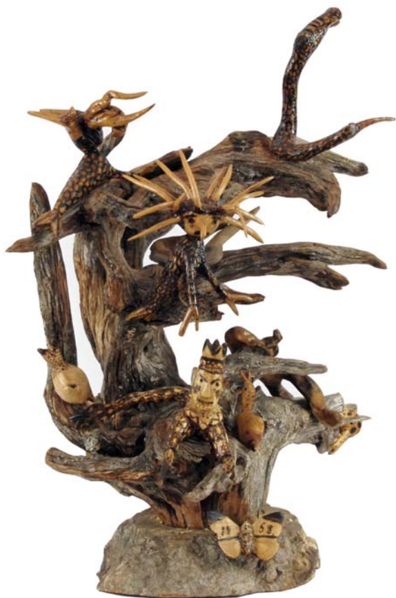
062 1958 (Br:55 cm. H:63 cm. Dj:45 cm.)