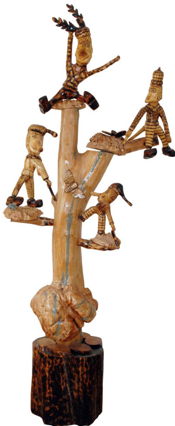
061 1996 (Br:63 cm. H:155 cm. Dj:38 cm.)