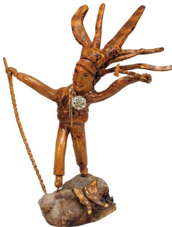
029 1975 (Br:45 cm. H:60 cm. Dj:30 cm.)