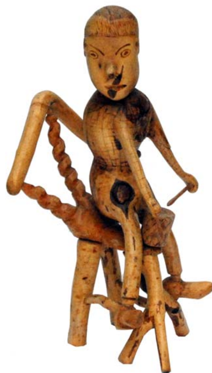
007 (Br:17 cm. H:31 cm. Dj:19 cm.)