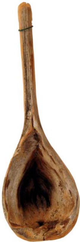
173 (Br:15 cm. H:45 cm. Dj:16 cm.)