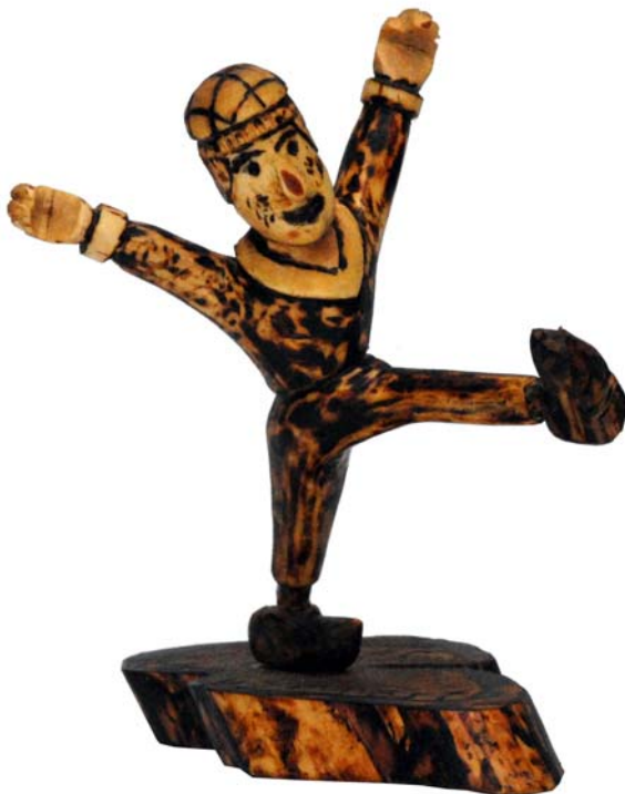
018 (Br:13 cm. H:21 cm. Dj:13 cm.)