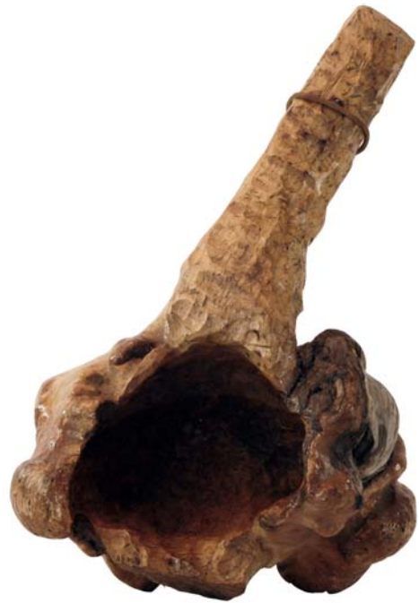
172 1972 (Br:33 cm. H:43 cm. Dj:22 cm.)