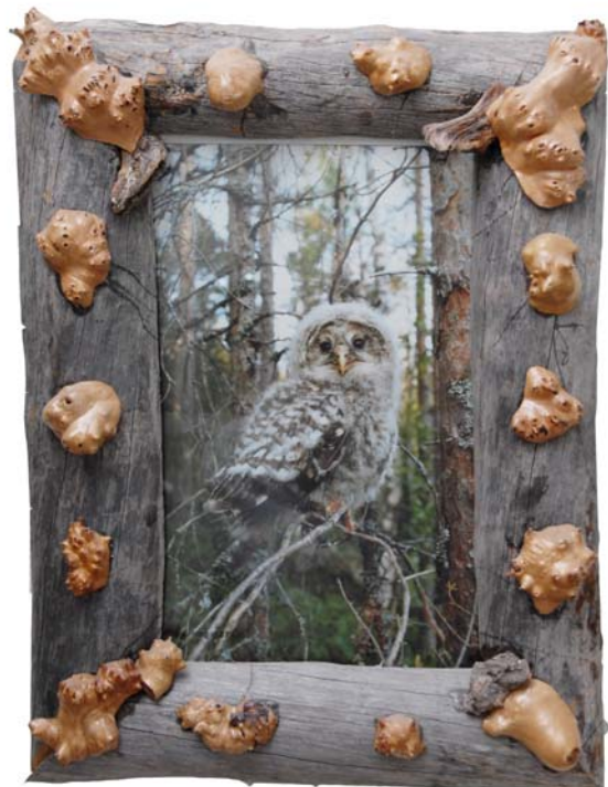
155 (Br:35 cm. H:46 cm. Dj:12 cm.)