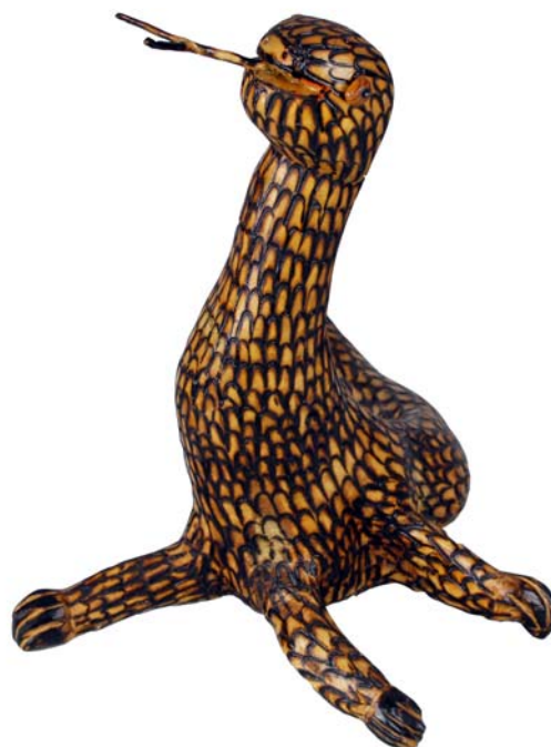
186 (Br:48 cm. H:40 cm. Dj:40 cm.)