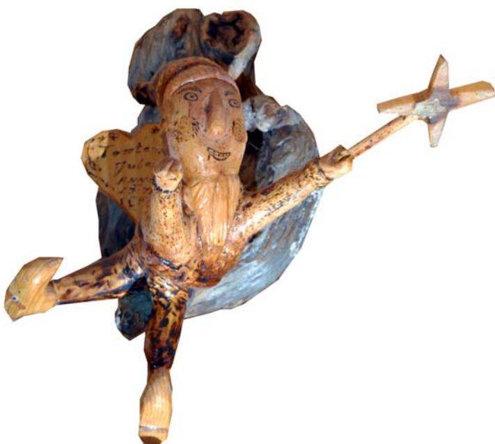
105 Tomten julen 1978 (Br:29 cm. H:30 cm. Dj:22 cm.)