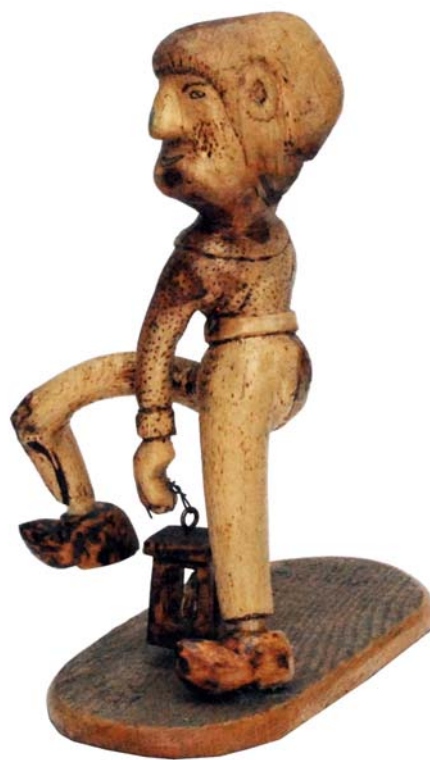
093 (Br:30 cm. H:32 cm. Dj:16 cm.)