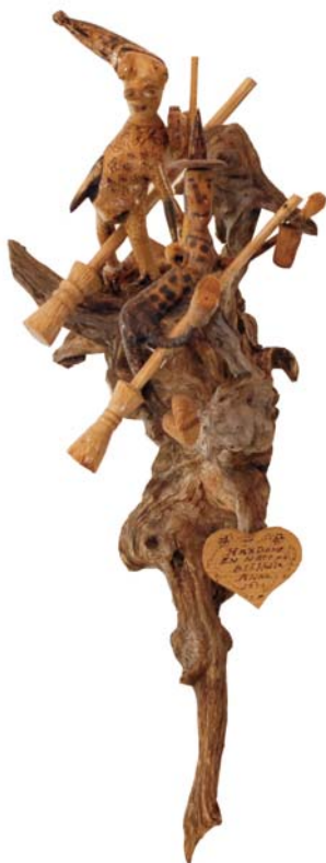
060 Häxdans en natt på Blåkulla 1979 (Br:30 cm. H:67 cm. Dj:49 cm.)