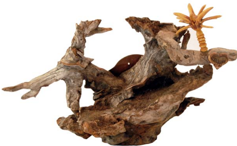
057 (Br:55 cm. H:39 cm. Dj:25 cm.)