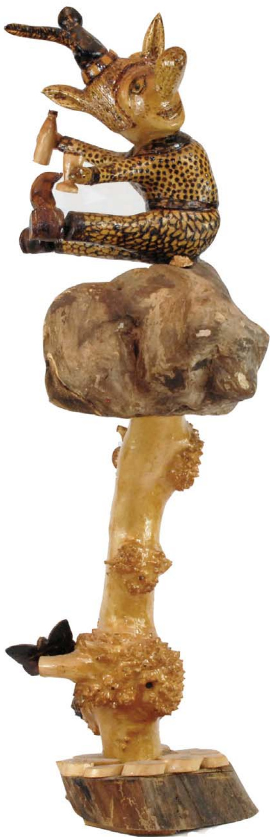
086 1996 (Br:37 cm. H:100 cm. Dj:37 cm.)