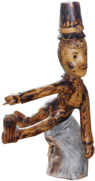
032 (Br:16 cm. H:30 cm. Dj:19 cm.)