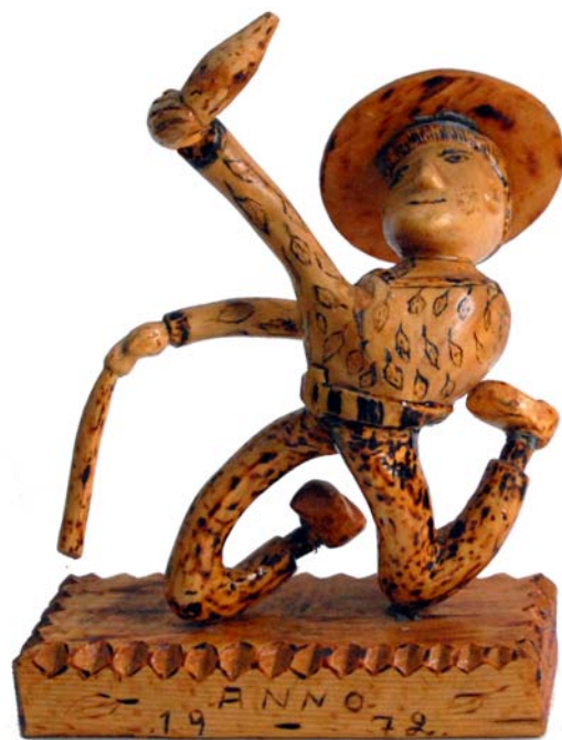
019 Periodsuparen 1972 (Br:22 cm. H:24 cm. Dj:15 cm.)