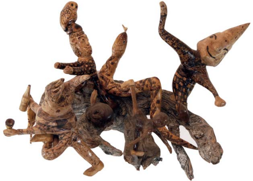
056 (Br:46 cm. H:40 cm. Dj:45 cm.)