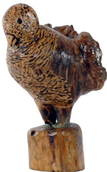
124 1956 (Br:19 cm. H:25 cm. Dj:17 cm.)