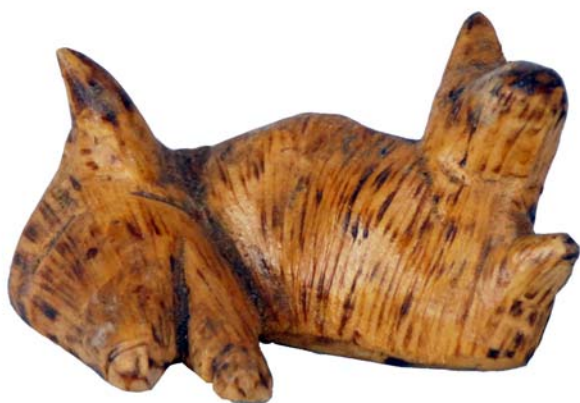
193 (Br:22 cm. H:18 cm. Dj:20 cm.)