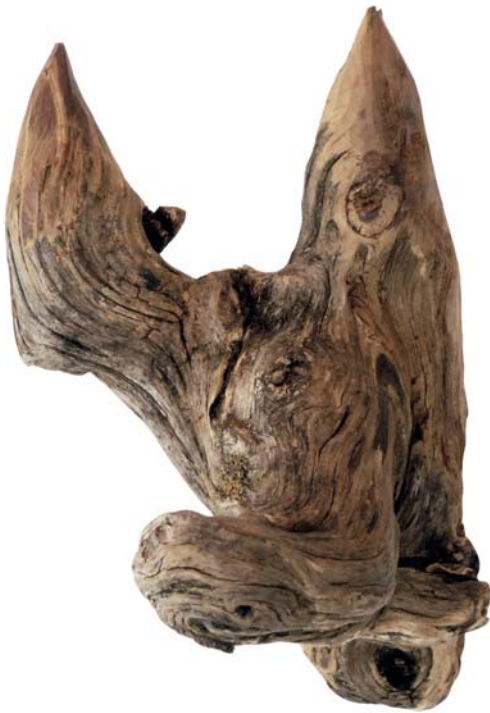
177 (Br:20 cm. H:32 cm. Dj:24 cm.)