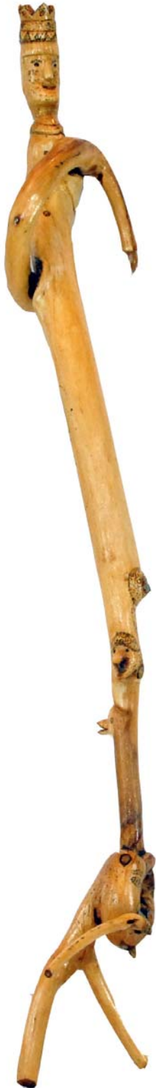
168 (Br:20 cm. H:95 cm. Dj:19 cm.)