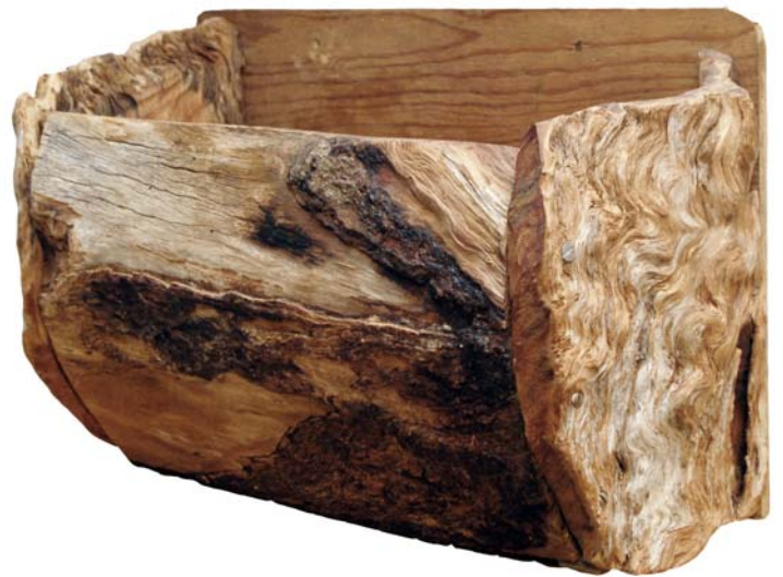
144 (Br:40 cm. H:30 cm. Dj:27 cm.)