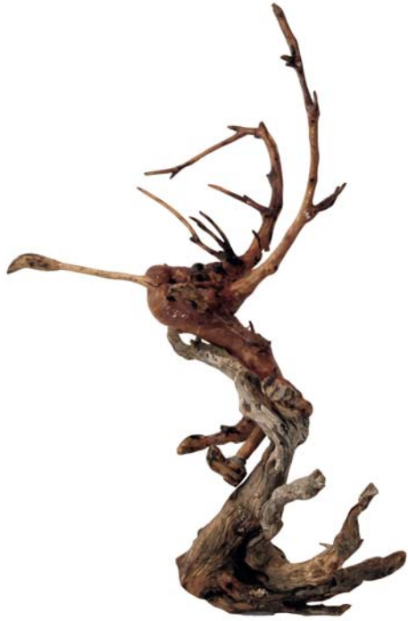
171 (Br:35 cm. H:50 cm. Dj:45 cm.)