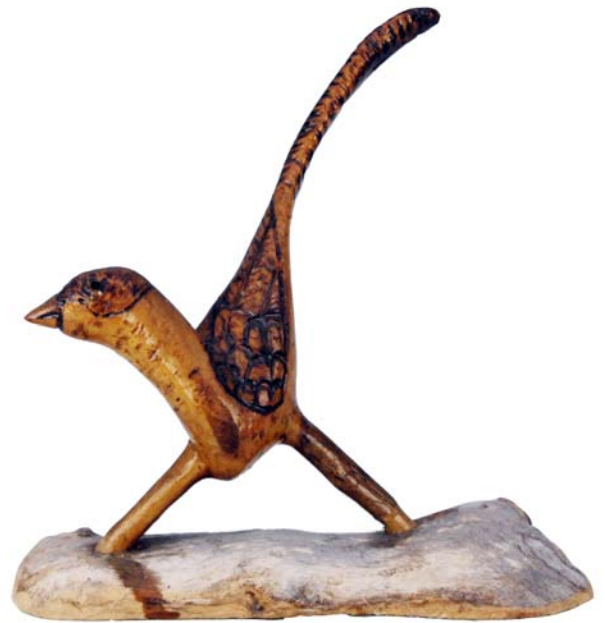
116 (Br:20 cm. H:20 cm. Dj:17 cm.)