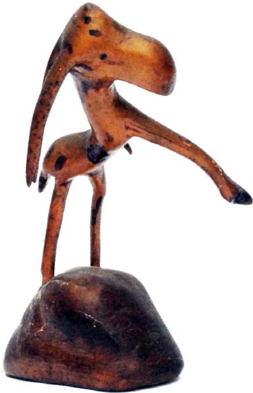
179 (Br:20 cm. H:28 cm. Dj:18 cm.)