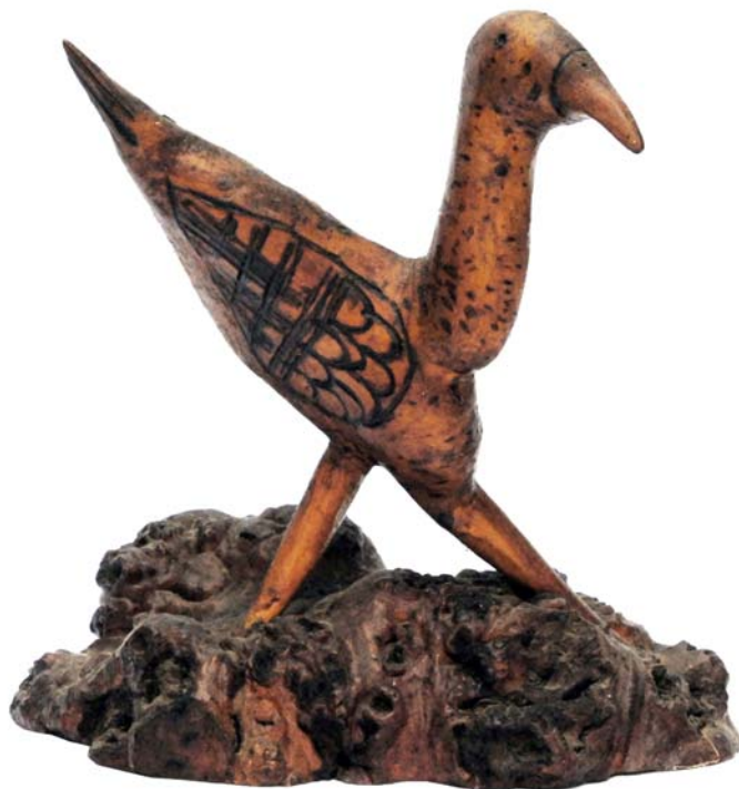
117 (Br:25 cm. H:28 cm. Dj:20 cm.)