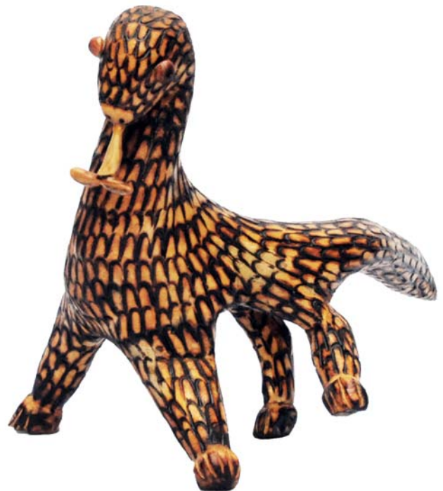
182 (Br:35 cm. H:28 cm. Dj:23 cm.)