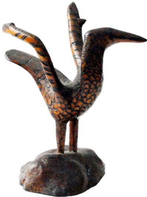
113 (Br:18 cm. H:22 cm. Dj:20 cm.)