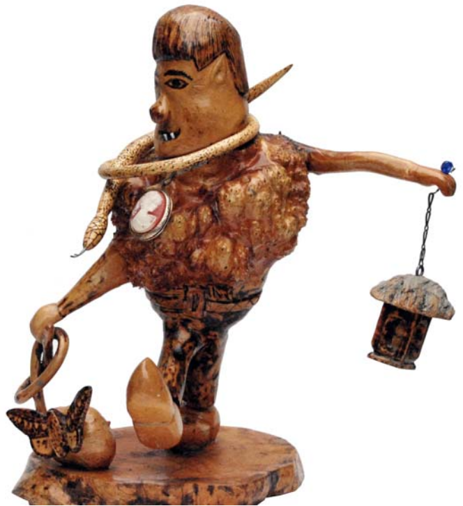
089 1970 (Br:45 cm. H:43 cm. Dj:30 cm.)