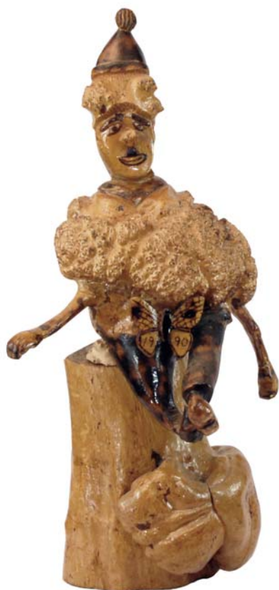
048 1990 (Br:47 cm. H:82 cm. Dj:39 cm.)