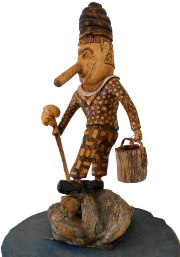
001 (Br:39 cm. H:70 cm. Dj:32 cm.)