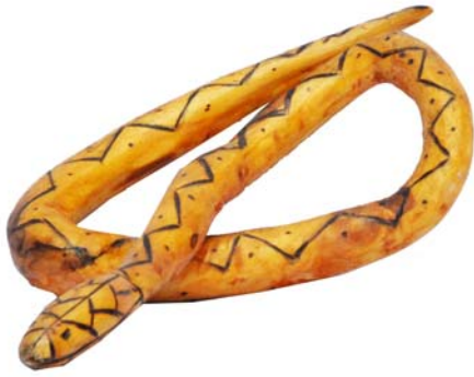
202 (Br:17 cm. H:10 cm. Dj:15 cm.)