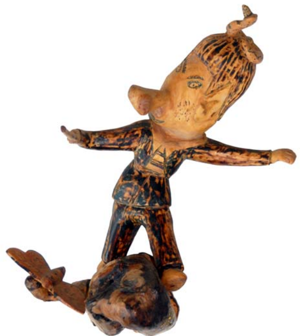
027 (Br:23 cm. H:30 cm. Dj:29 cm.)