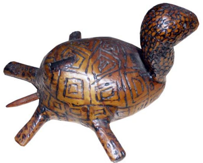
198 1972 (Br:20 cm. H:16 cm. Dj:19 cm.)