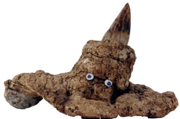
102 (Br:29 cm. H:19 cm. Dj:17 cm.)