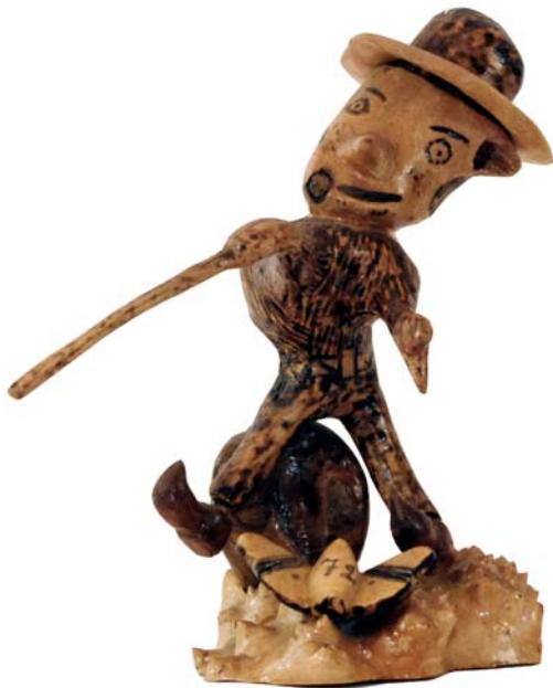
034 1972 (Br:19 cm. H:22 cm. Dj:23 cm.)