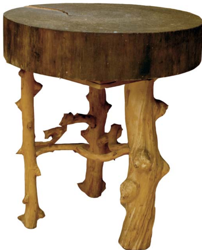
145 (Br:60 cm. H:65 cm. Dj:60 cm.)