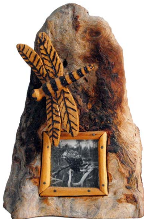
148 (Br:19 cm. H:26 cm. Dj:15 cm.)