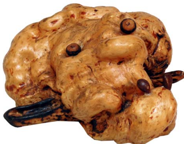
081 (Br:20 cm. H:25 cm. Dj:20 cm.)