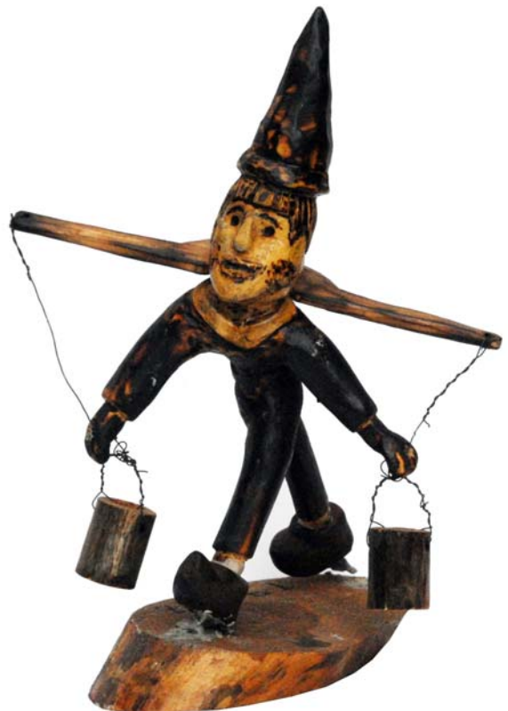
015 (Br:18 cm. H:29 cm. Dj:18 cm.)