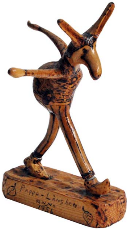
016 Pappa Långben 1956 (Br:21 cm. H:31 cm. Dj:15 cm.)