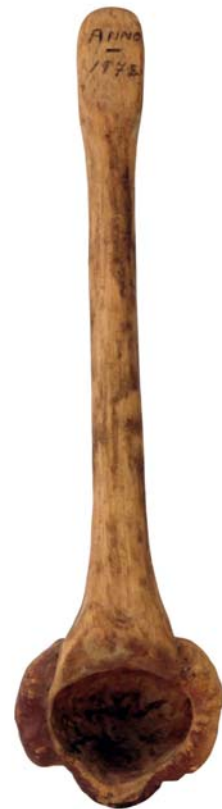
174 1972 (Br:14 cm. H:44 cm. Dj:10 cm.)