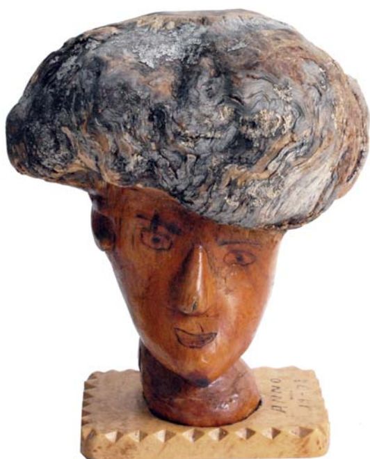
074 1972 (Br:30 cm. H:32 cm. Dj:20 cm.)