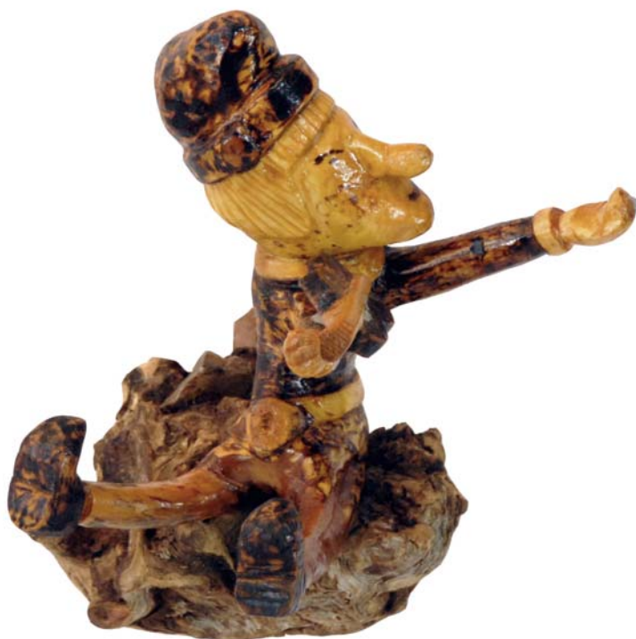
050 (Br:27 cm. H:28 cm. Dj:25 cm.)