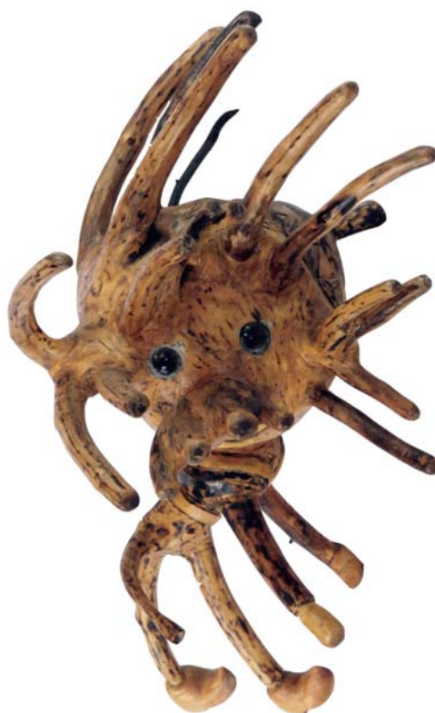
085 (Br:30 cm. H:52 cm. Dj:37 cm.)