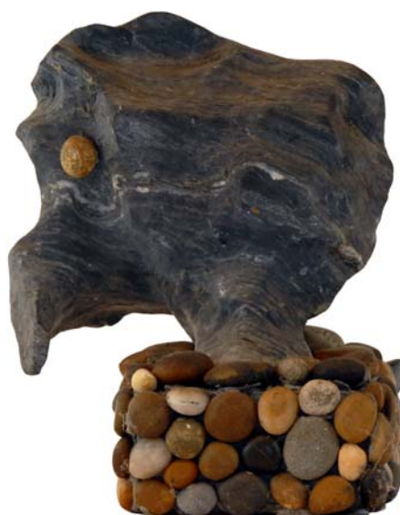
135 (Br:20 cm. H:24 cm. Dj:15 cm.)