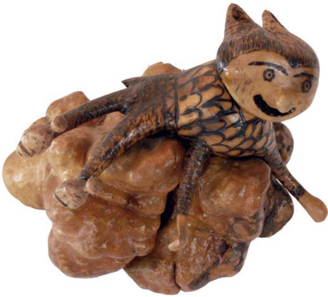
195 (Br:27 cm. H:25 cm. Dj:17 cm.)