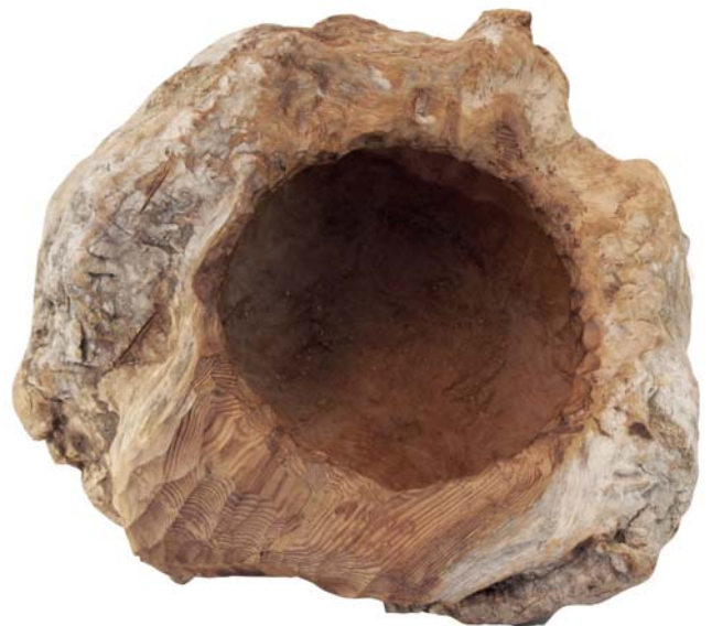
167 1972 (Br:42 cm. H:23 cm. Dj:43 cm.)