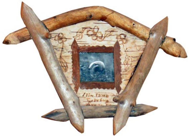
159 Min tama grävling (Br:36 cm. H:25 cm. Dj:6 cm.)