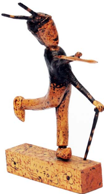
026 1970 (Br:30 cm. H:45 cm. Dj:20 cm.)