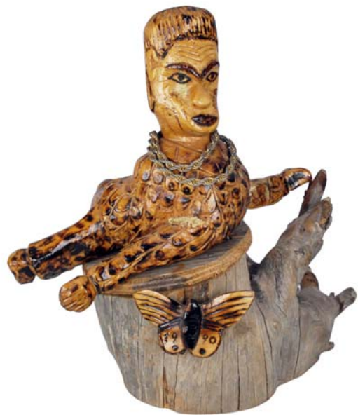
023 1990 (Br:40 cm. H:40 cm. Dj:35 cm.)