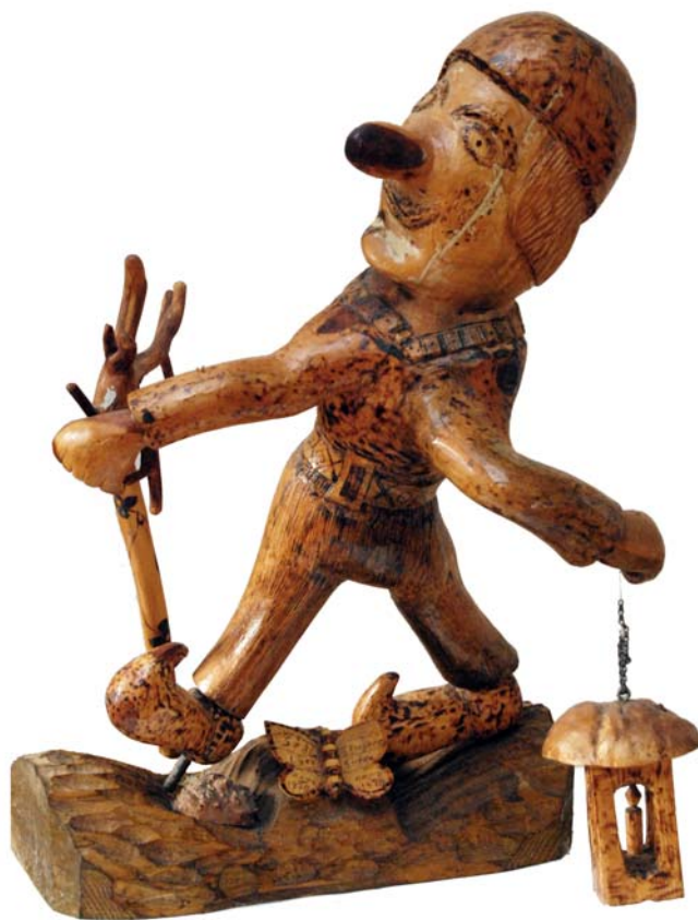
094 (Br:70 cm. H:56 cm. Dj:72 cm.)