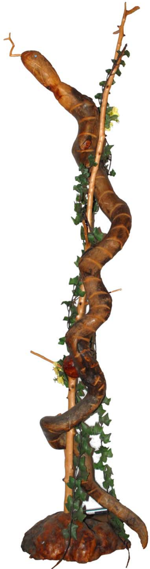
209 (Br:45 cm. H:180 cm. Dj:40 cm.)