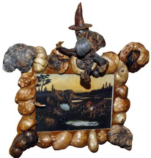
153 (Br:57 cm. H:57 cm. Dj:25 cm.)