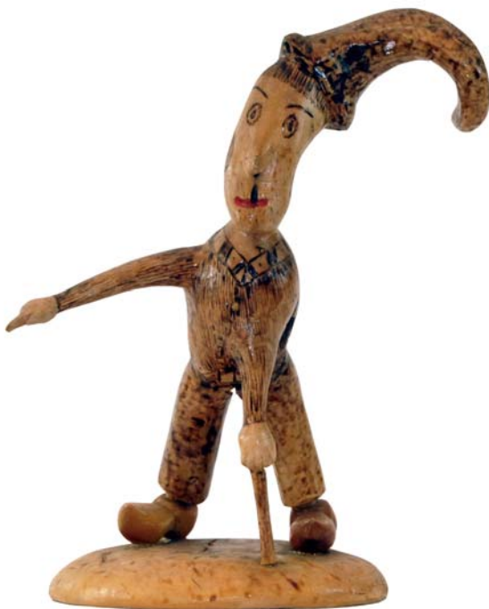
038 (Br:19 cm. H:28 cm. Dj:15 cm.)