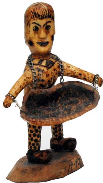
004 1992 (Br:22 cm. H:35 cm. Dj:23 cm.)