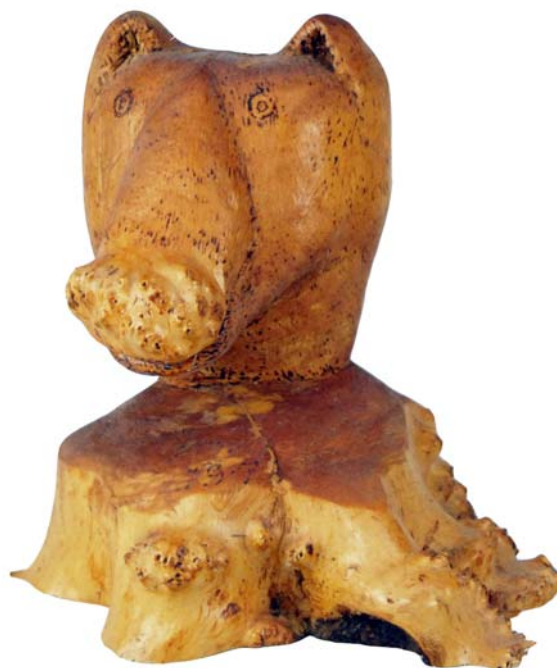
194 (Br:20 cm. H:22 cm. Dj:20 cm.)