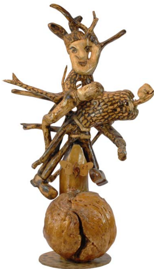
049 1988 (Br:55 cm. H:95 cm. Dj:40 cm.)