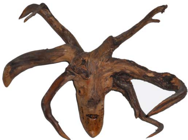
080 (Br:40 cm. H:35 cm. Dj:19 cm.)