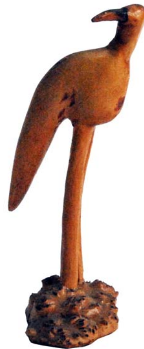
112 (Br:7 cm. H:16 cm. Dj:7 cm.)