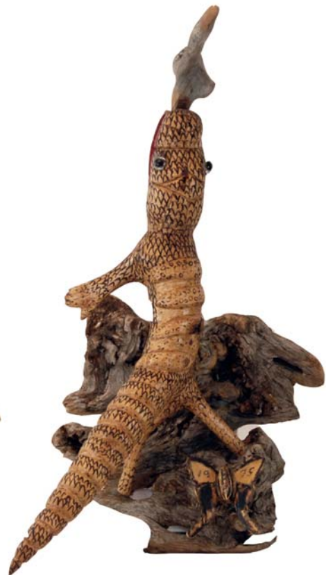
190 1975 (Br:32 cm. H:58 cm. Dj:35 cm.)