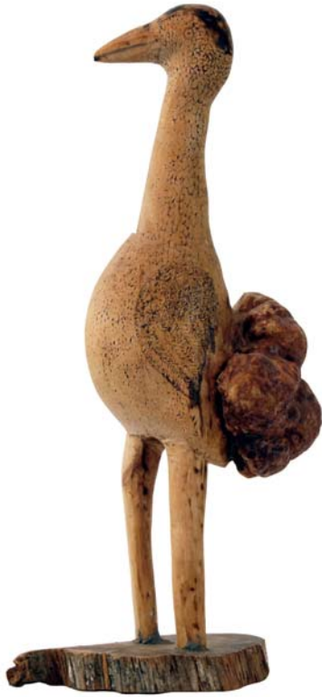
130 (Br:20 cm. H:44 cm. Dj:16 cm.)