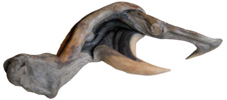
169 (Br:35 cm. H:45 cm. Dj:20 cm.)