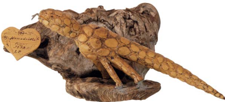
189 Kommodoödla 1979 (Br:48 cm. H:30 cm. Dj:23 cm.)