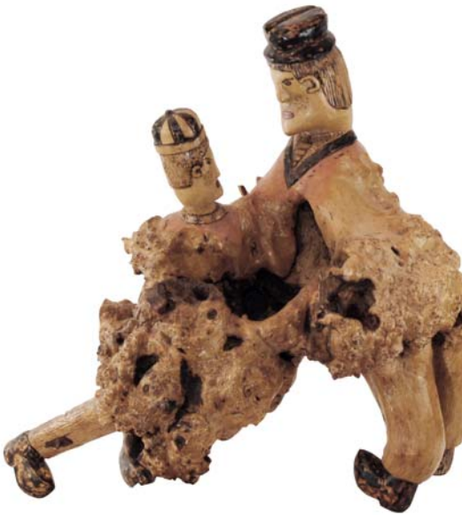
055 (Br:65 cm. H:58 cm. Dj:53 cm.)