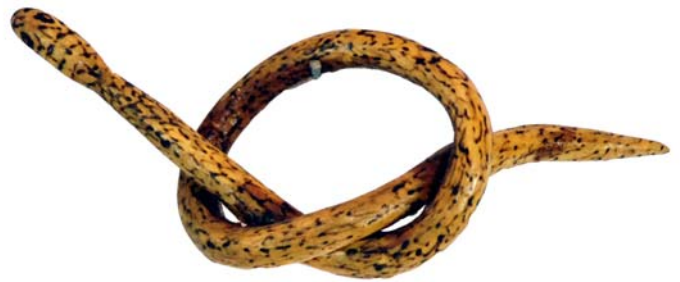
205 (Br:17 cm. H:10 cm. Dj:5 cm.)