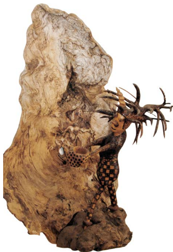
087 (Br:55 cm. H:88 cm. Dj:58 cm.)