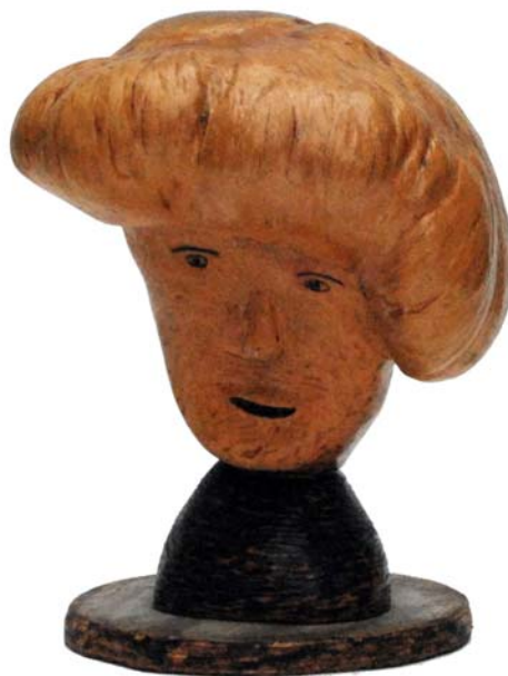
079 (Br:17 cm. H:21 cm. Dj:15 cm.)