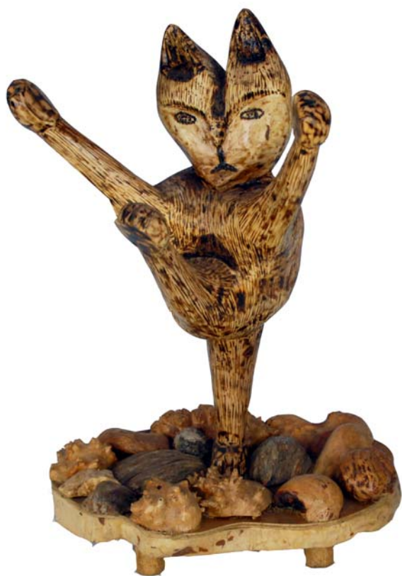
191 (Br:37 cm. H:47 cm. Dj:35 cm.)