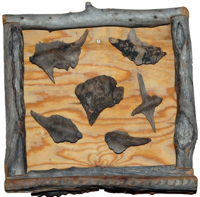
151 (Br:37 cm. H:6 cm. Dj:14 cm.)