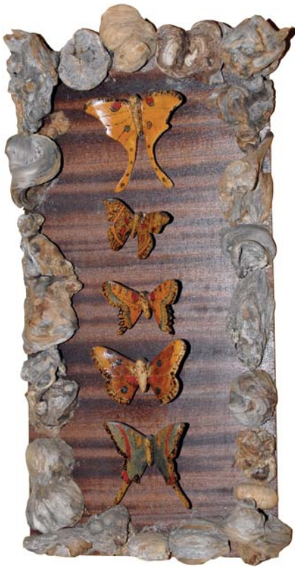
150 (Br:30cm. H:61 cm. Dj:10 cm.)