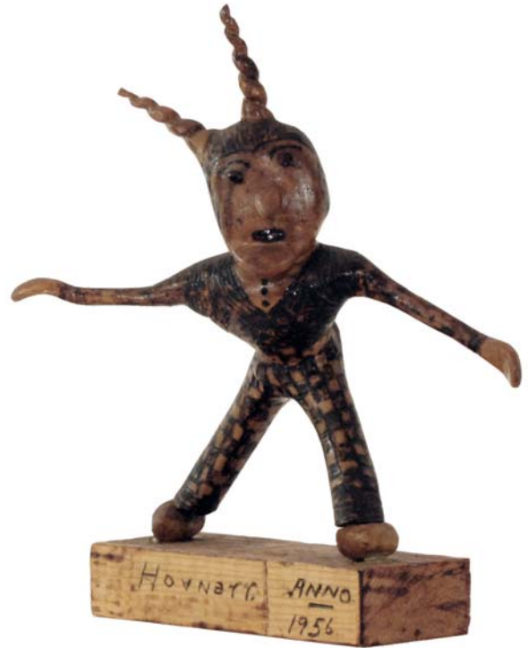
033 Hovnarr 1956 (Br:24 cm. H:30 cm. Dj:17 cm.)