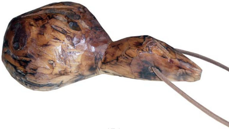
175 1972 (Br:16 cm. H:39 cm. Dj:10 cm.)