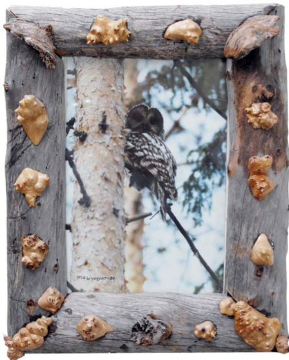
156 (Br:37 cm. H:44 cm. Dj:13 cm.)