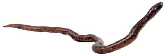
203 (Br:60 cm. H:20 cm. Dj:20 cm.)