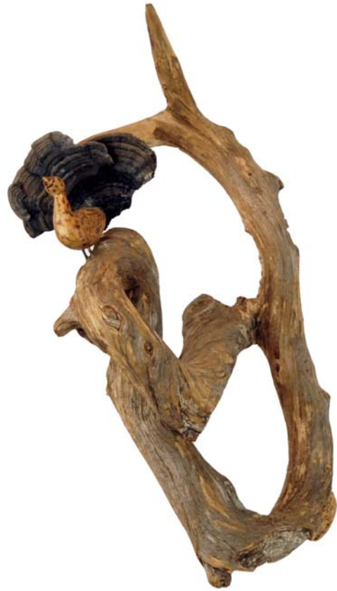
131 (Br:35 cm. H:49 cm. Dj:17 cm.)