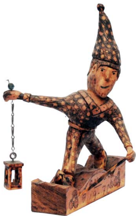
092 1971 (Br:23 cm. H:35 cm. Dj:28 cm.)