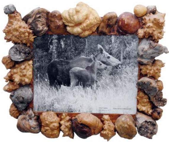
158 (Br:64 cm. H:55 cm. Dj:20 cm.)