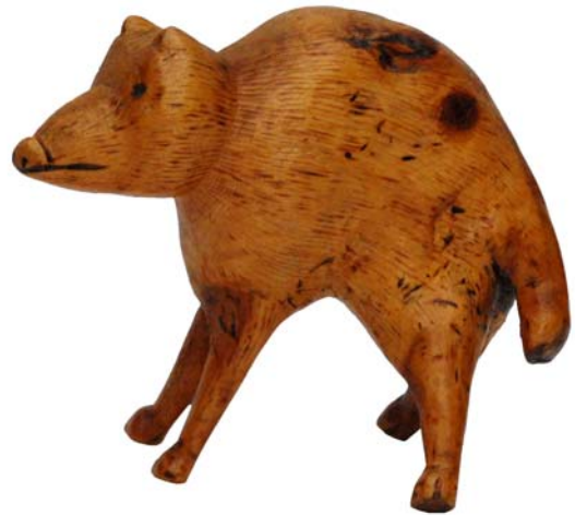
180 (Br:16 cm. H:15 cm. Dj:12 cm.)