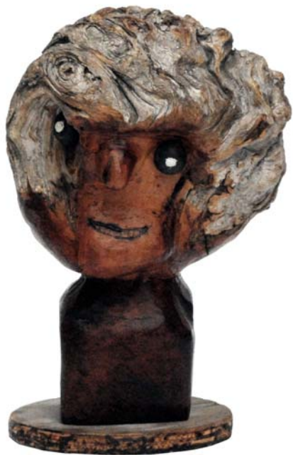
078 (Br:17 cm. H:27 cm. Dj:15 cm.)