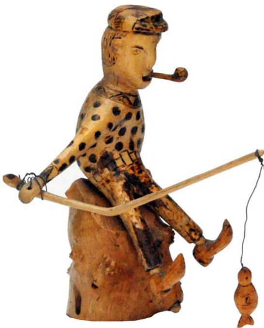
006 1968 (Br:23 cm. H:24 cm. Dj:20 cm.)