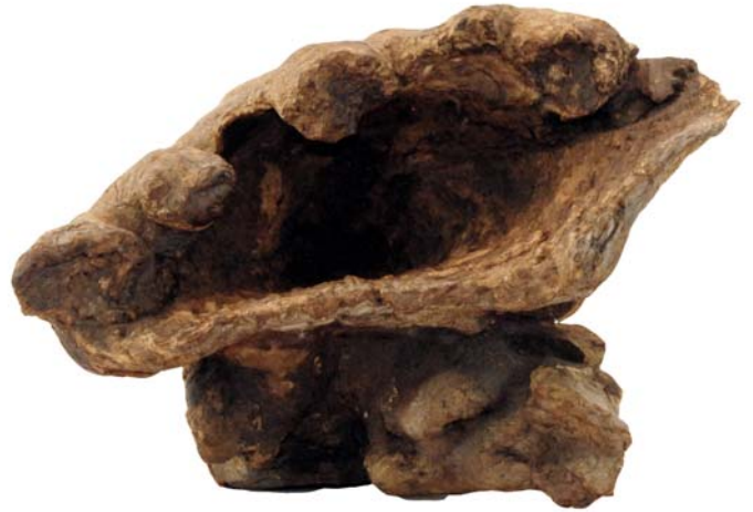
165 1961 (Br:29 cm. H:21 cm. Dj:24 cm.)