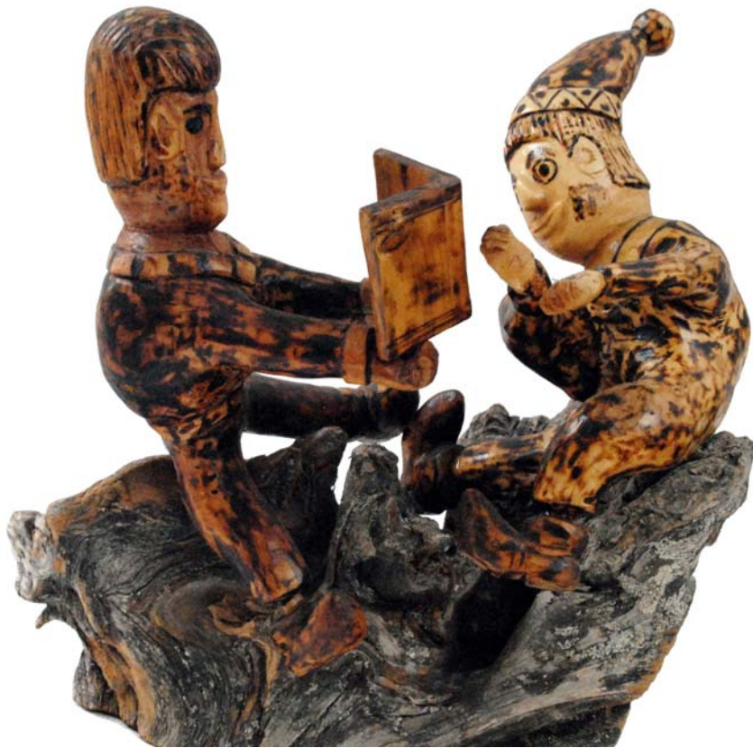
005 (Br:27 cm. H:32 cm. Dj:20 cm.)