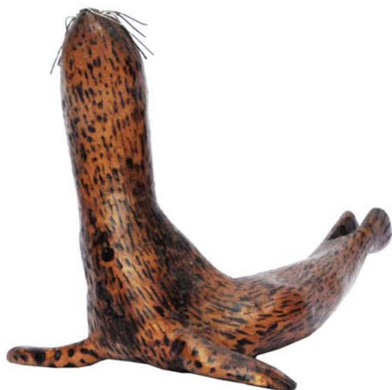
183 (Br:22 cm. H:16 cm. Dj:15 cm.)