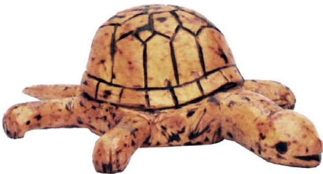
181 (Br:25 cm. H:10 cm. Dj:20 cm.)