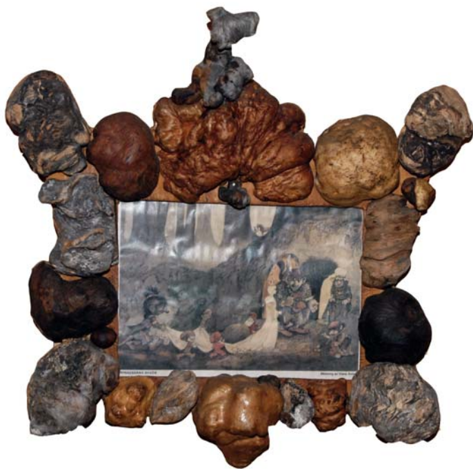
154 (Br:50 cm. H:47 cm. Dj:15 cm.)