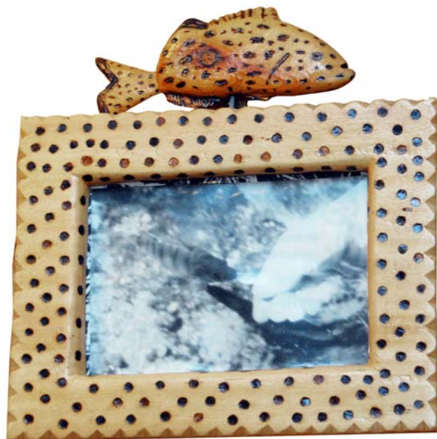
157 (Br:26 cm. H:27 cm. Dj:3 cm.)