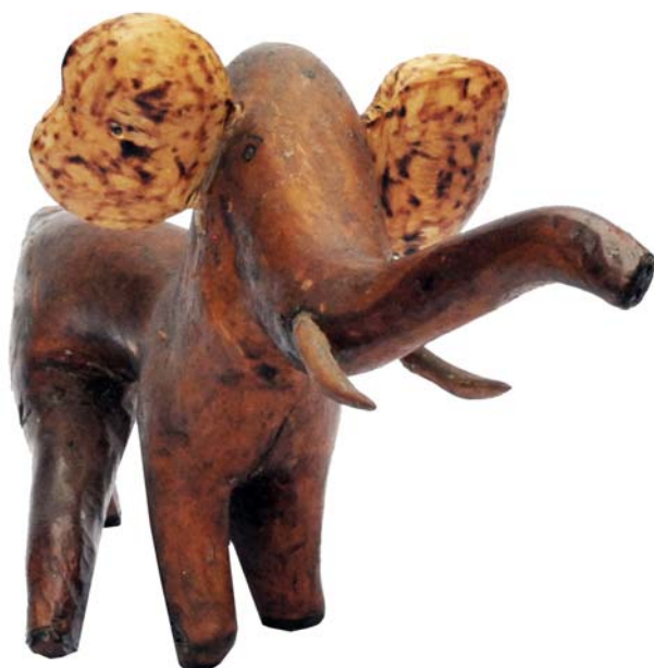
185 (Br:50 cm. H:28 cm. Dj:22 cm.)