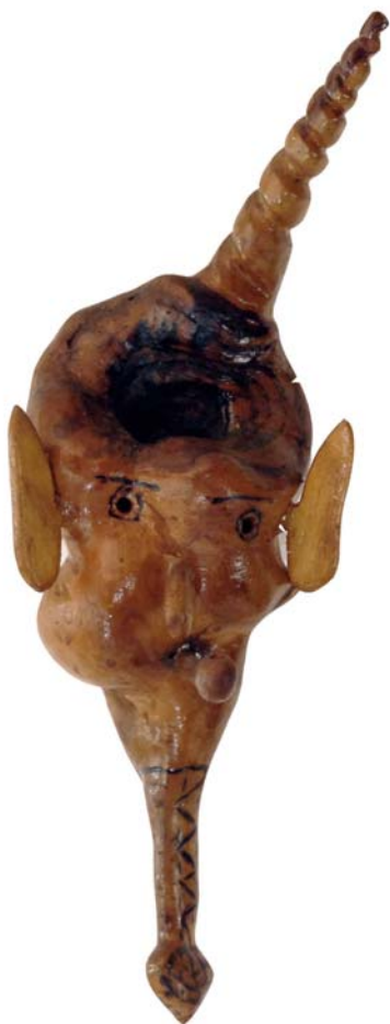
082 (Br:13 cm. H:35 cm. Dj:15 cm.)