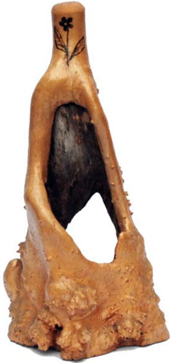
164 (Br:28 cm. H:56 cm. Dj:25 cm.)