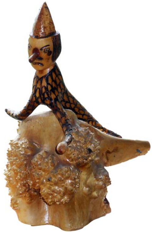
100 (Br:16 cm. H:29 cm. Dj:25 cm.)