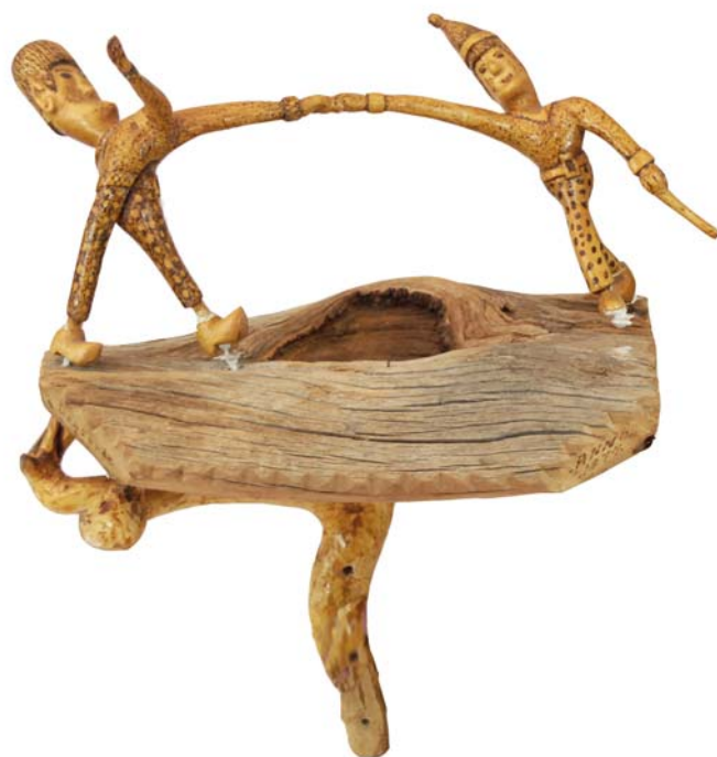
051 (Br:55 cm. H:44 cm. Dj:34 cm.)