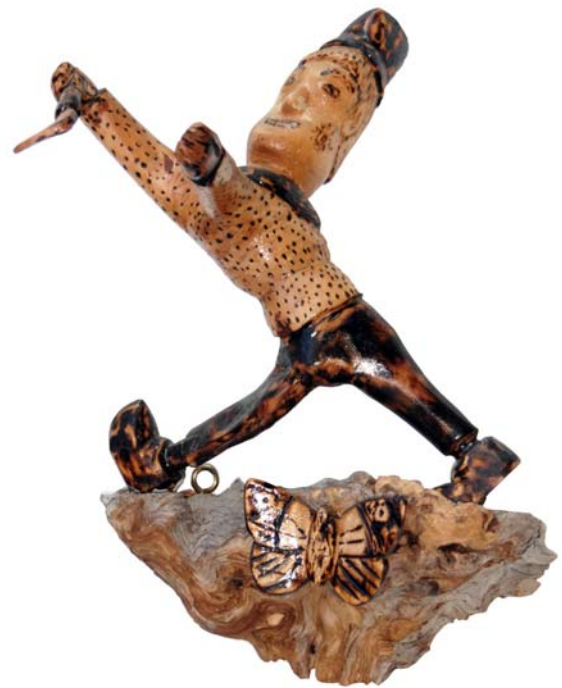
025 (Br:23 cm. H:32 cm. Dj:22 cm.)