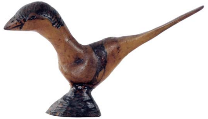
119 (Br:16 cm. H:10 cm. Dj:11 cm.)