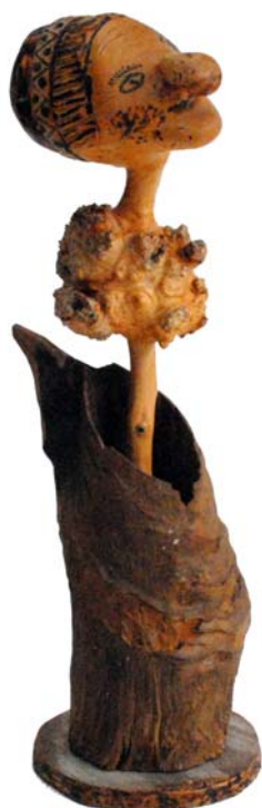
076 (Br:16 cm. H:42 cm. Dj:20 cm.)