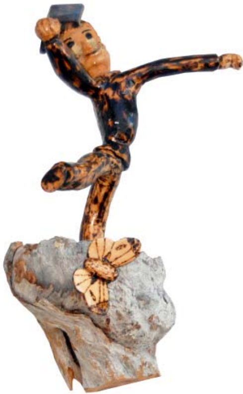
024 (Br:23 cm. H:35 cm. Dj:20 cm.)